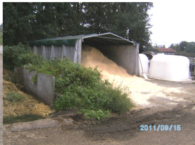
Afb. 4; foto links, locatie van boring 1 en 3, foto rechts, locatie van boring 2 (groenstrook).