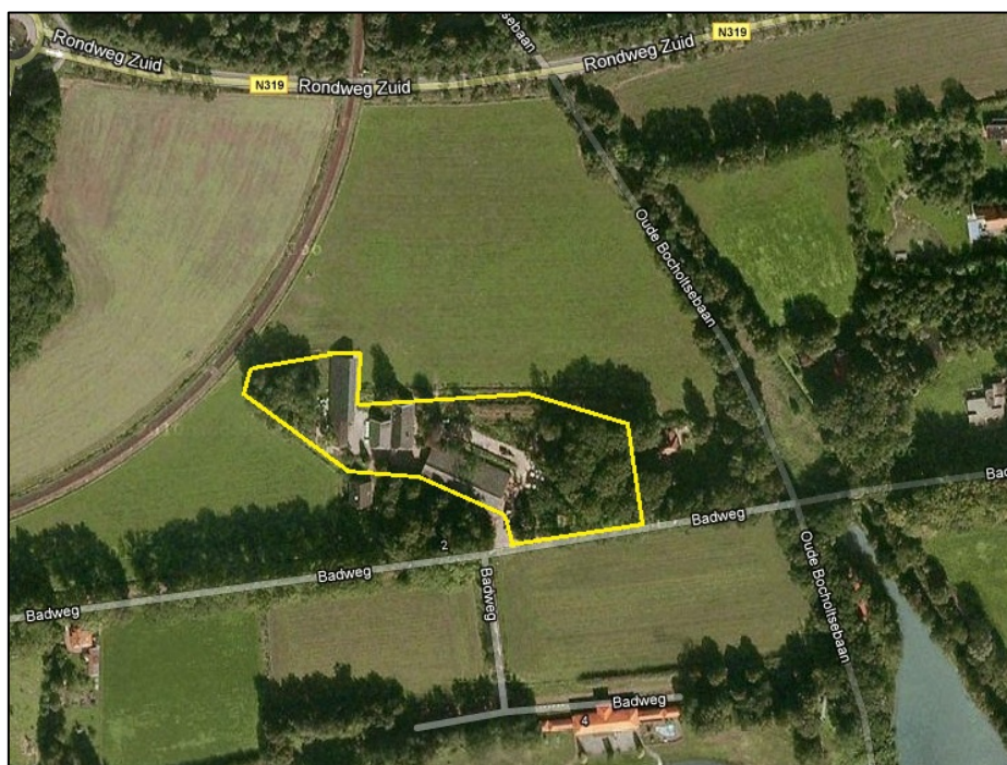
Figuur 1: Ligging van de onderzoekslocatie (binnen gele omlijning) aan de Badweg te Winterswijk.

Het plangebied betreft het erf en aangrenzende bosschages aan de Badweg 1 en is gelegen in het buitengebied van Winterswijk (zie figuur 1). Het plangebied bestaat onder andere uit een woonboerderij, schuren en bosschages. De plannen bestaan uit een uitbreiding van de werktuigenschuur en ligboxenstal op de locatie. Bestaande bosschages zullen daarvoor worden verwijderd. In de toekomst zal weer een singel met bomen en struiken worden aangeplant. Permanent oppervlaktewater ontbreekt op de locatie.