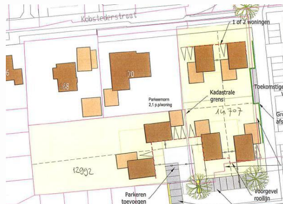
Globale ligging plangebied (links) en toekomstige inrichting (rechts)