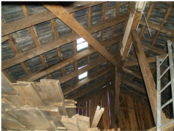
Afb.3. aanzicht op de dakconstructie. Geen beschoten kap, dit biedt geen nestgelegenheid aan Huismus en Steenuil. In de schuur bevindt zich geen Kerkuilenkast.

In verband met de mogelijke aanwezigheid van broedvogels in de gebouwen wordt geadviseerd om de gebouwen buiten de broedtijd te slopen