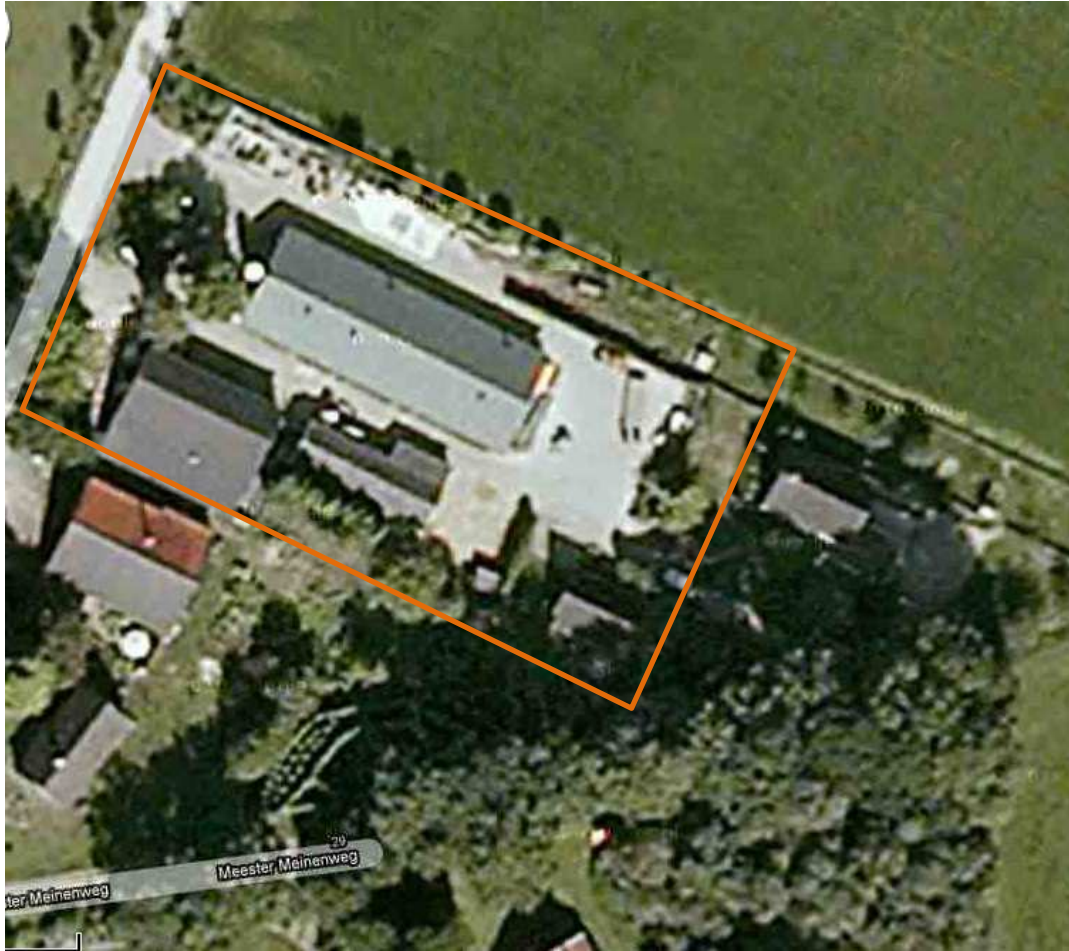
Afbeelding 2. Detailopname van het plangebied. Het onderzochte gebied wordt met de oranje contour aangeduid.

Het plangebied ligt in de het buitengebied van Kotten, een buurtschap in de gemeente Winterswijk.