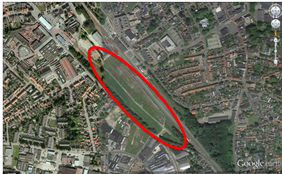
Figuur I.1 overzicht locatie.

De gemeente Winterswijk is voornemens de spoorzone opnieuw te gaan ontwikkelen. Daarbij wordt onder meer voorzien de behoefte aan diverse branches zoals een bouwmarkt, meubelwinkels, PDV (plant en dier, rijwiel, sport en spel), horeca e.d. Deze ontwikkeling leidt tot de generatie van extra verkeer naar de spoorzone. In de memo "Verkeersgeneratie Spoorzone fase 4" is aangegeven hoeveel extra verkeer wordt verwacht door de herontwikkeling. In dit onderzoek wordt nagegaan of deze ontwikkelingen een goede ruimtelijke ordening beïnvloeden.