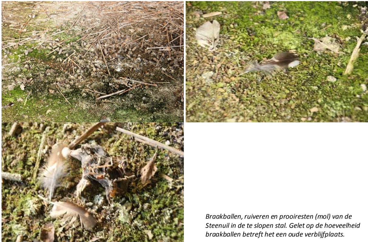
Braakballen, ruiveren en prooiresten (mol) van de Steenuil in de te slopen stal. Gelet op de hoeveelheid braakballen betreft het een oude verblijfplaats.

In het deelgebied aan de Eibergseweg nestelen geen vogels en het vormt geen essentieel onderdeel van beschermd functionele leefgebied van vogels. In de stal aan de Lemmenesweg nestelt een paartje Steenuilen. Gelet op de hoeveelheid braakballen in de schuur, is deze schuur al enige jaren in gebruik als nest- en verblijfplaats. De uilen nestelen onder de golfplaten. Mogelijk nestelen ook andere soorten, zoals Spreeuw en Witte Kwikstaart in de stal. Op het erf zijn geen Huismussen waargenomen.