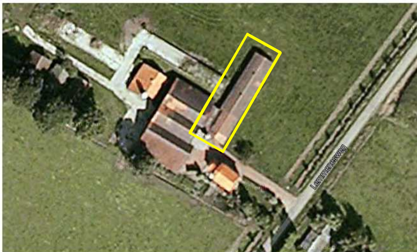
Deelgebied Lemmenesweg 3

Deelgebied Lemmenesweg 3 in Meddo bestaat uit een oude stal op een (voormalig) agrarisch erf. Het betreft een houten stal, gedelt met golfplaat. De stal heeft niet geïsoleerde houten wanden en dakisolatie van riet. Op enkele plekken wordt deze isolatie ondersteund door een houten plaat. Open water en opgaande beplanting ontbreken in dit deelgebied. Op onderstaande afbeelding wordt het plangebied in detail weergegeven.