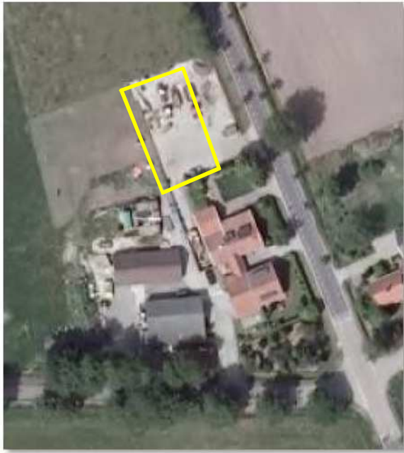
Deellocatie Eibergseweg 7.