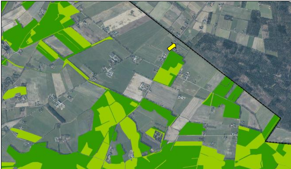
Figuur 11. Ligging onderzoekslocatie ten opzichte van het Natuurnetwerk Nederland (donkergroen: Gelders Natuurnetwerk, lichtgroen: Groene ontwikkelingszone).

De onderzoekslocatie maakt geen deel uit van het Natuurnetwerk. Op een afstand van circa 130 meter ten zuiden bevindt zich het dichtstbijzijnde natuurnetwerkgebied, Het betreft een bebost perceel aangewezen als Gelders Natuurnetwerk. In figuur 11 is de ligging van de onderzoekslocatie ten opzichte van het Natuurnetwerk Nederland weergegeven.