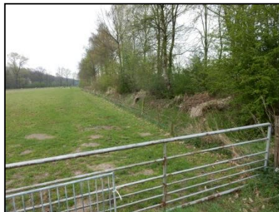
Figuur 4. Schapenweide en houtwal langs zuidzijde.