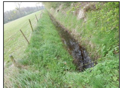
Figuur 5. Greppel langs zuidzijde schapenweide.