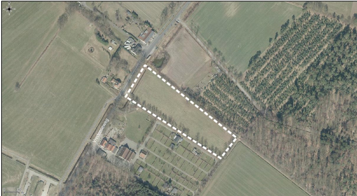
Figuur 2. Luchtfoto onderzoekslocatie en directe omgeving.