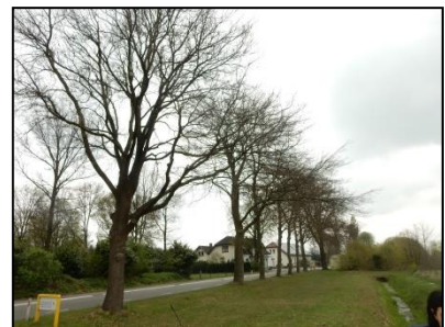
Figuur 8. Bomen langs Vredenseweg.