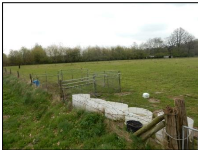
Figuur 3. Overzichtsfoto schapenweide.