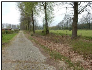
Figuur 7. Houtwal en zicht op schapenweide in noordoostelijke richting.