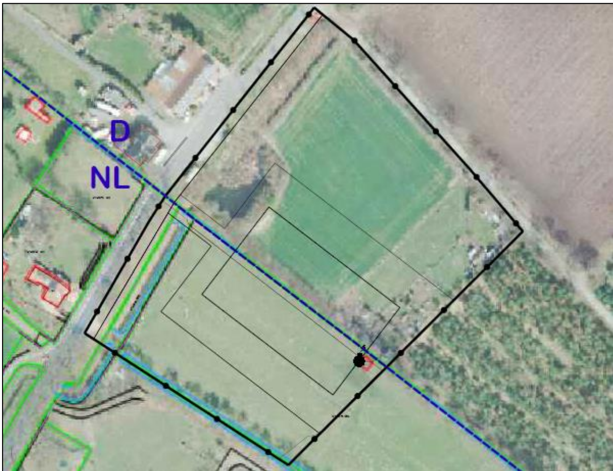
Figuur 9. Contouren nieuwbouw, exacte inrichting is nog niet definitief.

De initiatiefnemer is voornemens een nieuw dienstencentrum te bouwen op de onderzoekslocatie. De contouren van de nieuwe bebouwing is weergegeven in figuur 9, echter is de exacte inrichting vooralsnog niet definitief, dit kan nog gewijzigd worden. De gemeenten Winterswijk en Vreden hebben samen de ambitie om op de grens aan de Vredenseweg een Euregionaal grensoverschrijdend, duurzaam dienstencentrum te ontwikkelen met daarin een grensoverschrijdend arbeidsbureau. Voor het Duitse grondgebied is eveneens een onderzoek verricht in het kader van flora en fauna. In hoeverre de houtsingel of wateren worden aangetast door de ingreep is vooralsnog niet bekend.