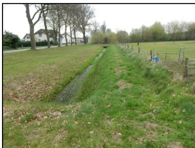
Figuur 6. Sloot langs noordwestzijde perceel.