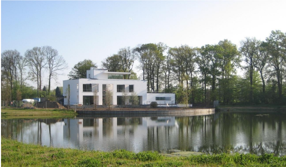
De nieuwe villa aan de retentievijver

Ook op de andere locatie ligt de kans om het plan ook naar buiten toe een bijzondere uitstraling te geven. De twee voornamelijk huizen mogen zich in grootte nadrukkelijk onderscheiden van alle andere te bouwen villa's in dit plan. Huizen, die zowel qua ligging, langs een oude doorgaande weg, als qua uitstraling verwijzen naar een belangrijk stukje cultuurhistorie van Winterswijk, waar op veel plaatsen in het buitengebied grote statige landhuizen staan, op enige afstand van de weg. Een referentiebeeld van een historische woning is Huis Groters.