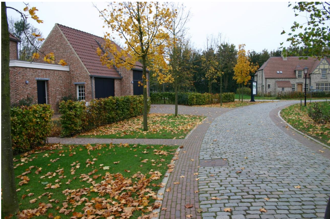
Suggestie voor de uiteindelijke vormgeving van de Laan van Napoleon

Veel belang wordt gehecht aan de architectonische kwaliteit van de woningen die in het plan zullen worden gebouwd. Om deze kwaliteit te waarborgen was al een beeldkwaliteitplan opgesteld. Naast een herziening van het bestemmingsplan is ook dit beeldkwaliteitplan licht aangepast.