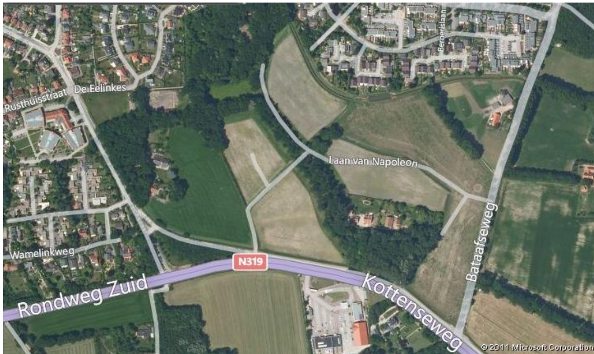
Luchtfoto van het plangebied, exclusief de laatste nieuwbouw.