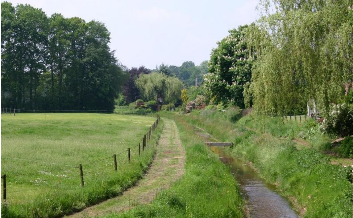
De Wehmerbeek nabij de Bataafseweg in zijn oorspronkelijke vorm

Behalve door de karakteristieke ruimtelijke afwisseling van het gebied wordt de locatie gekenmerkt door de aanwezigheid van de Wehmerbeek. Deze vormt de zuidgrens van de wijk Pelkwijk.