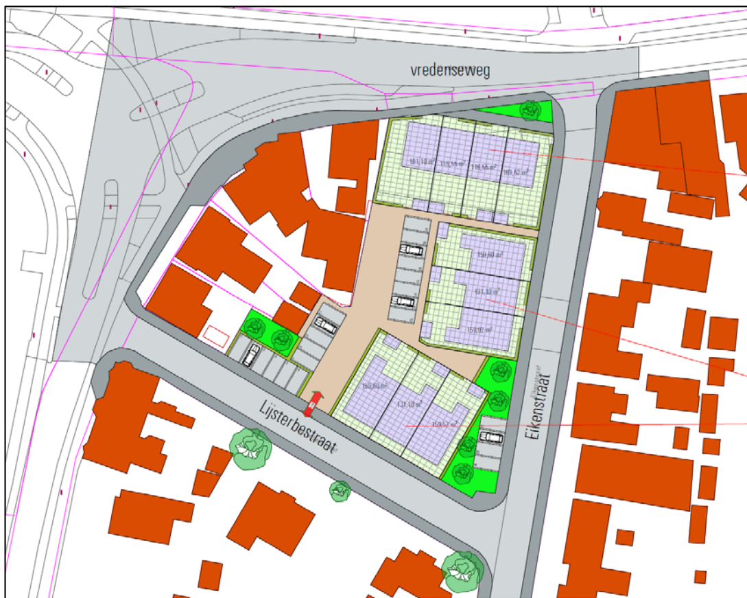
Ligging van de nieuwe woningen

Op de locatie aan de Vredensweg is een woningbouwplan met 10 woningen voorzien. In de onderstaande figuur is de ligging van de nieuwe woningen weergegeven.