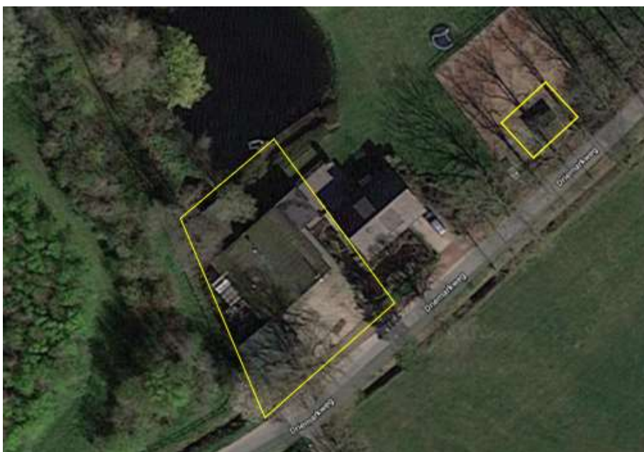
Luchtfoto van het het plangebied.

Het plangebied bestaat uit twee delen van een bestaand woonerf waar voorheen een installatiebedrijf was gevestigd. Het bestaat uit bebouwing en erfverharding. In het plangebied staan een schuur, een garage, een kapschuur en een klein houten kleindierenverblijf. De grote schuur heeft gedeeltelijk een buitengevel met luchtspouw. De grote schuur en garage zijn gedekt met golfplaten, de kapschuur en het kleindierenverblijf zijn gedekt met dakpannen. De garage heeft geen dakbeschot, het kleindierenverblijf wel. Aan de westzijde grenst het plangebied aan opgaande beplanting. Ten oosten van de grote schuur staat een vrijstaande woning. Ten noorden van het plangebied ligt een grote vijver. Op onderstaande luchtfoto wordt de begrenzing van het plangebied aangegeven. Voor een impressie van het plangebied wordt verwezen naar de fotobijlage.