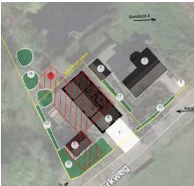
Verbeelding van het wenselijke eindbeeld. Op de kaart worden de contouren (rood) van de te slopen bebouwing weergegeven, evenals de nieuwe woning en schuur.