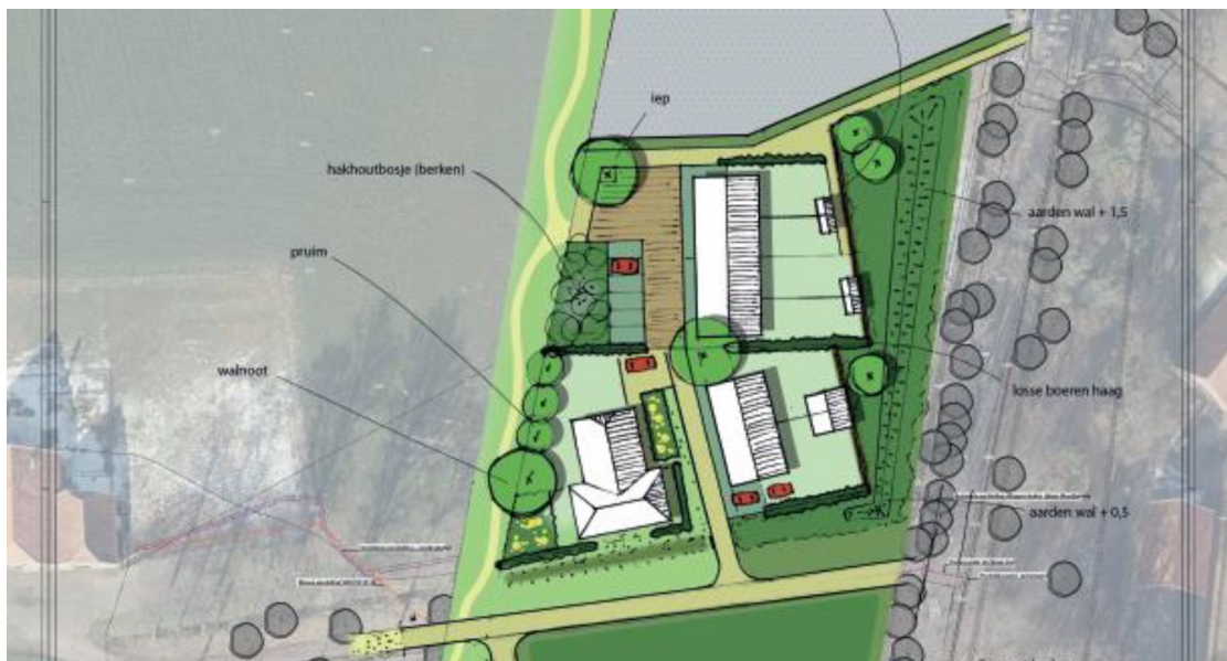
Figuur 3: Inrichtingsschets inclusief voorgestelde mitigerende maatregelen rond het noordelijk perceel aan de Meerdinkweg. In lichtgroen het kruidenrijk grasland, in donkerbruin takkenrillen, hagen in donkergroen en houtopstanden in groen (Metselaar, J., 2022)