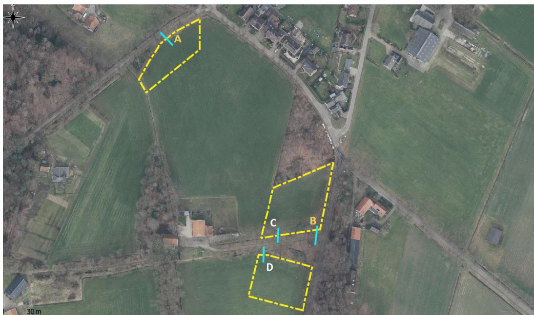
Figuur 5: Locaties aan te leggen faunapassages aangegeven met blauwe lijnen (Metselaar, J., 2022)