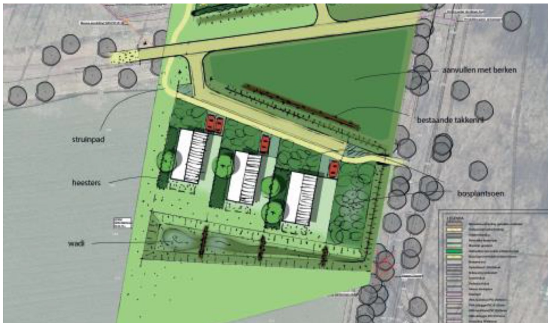
Figuur 4: Inrichtingsschets inclusief voorgestelde mitigerende maatregelen rond het zuidelijke perceel aan de Meerdinkweg. In donkerbruin de aan te leggen takkenrillen en in groen de houtopstanden (Metselaar, J., 2022)