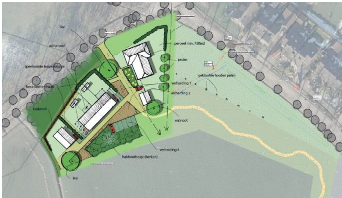
Figuur 2: Inrichtingsschets inclusief voorgestelde mitigerende maatregelen rond het perceel aan de Droppersweg. Met lichtgroen wordt het kruidenrijk grasland weergegeven, in het donkerbruin de aan te leggen takkenrillen en in donkergroen de locaties van aan te planten hagen. In het kruidenrijke grasland wordt een grondwalleetje aangelegd (Metselaar, J., 2022)