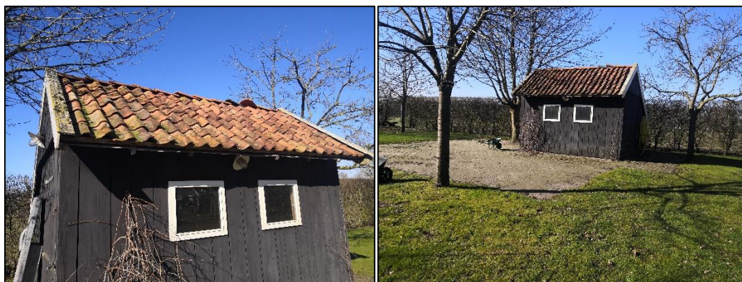
Figuur 2.3 (links): De kleine schuur op het meest zuidelijke perceel heeft een pannendak zonder dakbeschot en een zwarte houten muur; (figuur 2.4 (rechts): Een impressie van de omgeving van de kleine schuur.