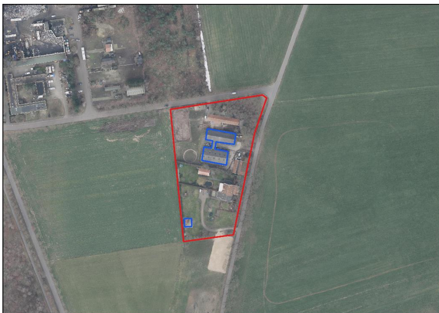
Figuur 2.2: Impressie van het plangebied.

Het plangebied (Figuur 2.2) bestaat uit meerdere woon- en bedrijfserven met woningen, stallen en bijgebouwen. De onderzochte gebouwen (blauw omlijnd in Figuur 2.2) betreffen de voormalige stallen, centraal op het plangebied en de schuur met directe omgeving op het meest zuidelijke plangebied.