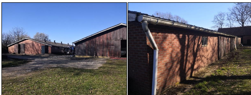
Figuur 2.7 (links): De oostzijde van de voormalige stallen op het centrale perceel; Figuur 2.8 (rechts): De zuidzijde van de stallen grenst aan een strook met gras. De muur bevat geen kieren.