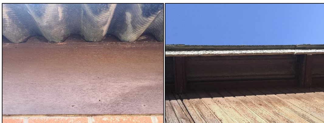
Figuur 2.9 (links): Het dak van beide stalgebouwen bestaat uit golfplaten welke goed aansluiten op de muur; Figuur 2.10 (rechts): De daklijst van de meest noordelijke houten schuur bevat geen kieren.