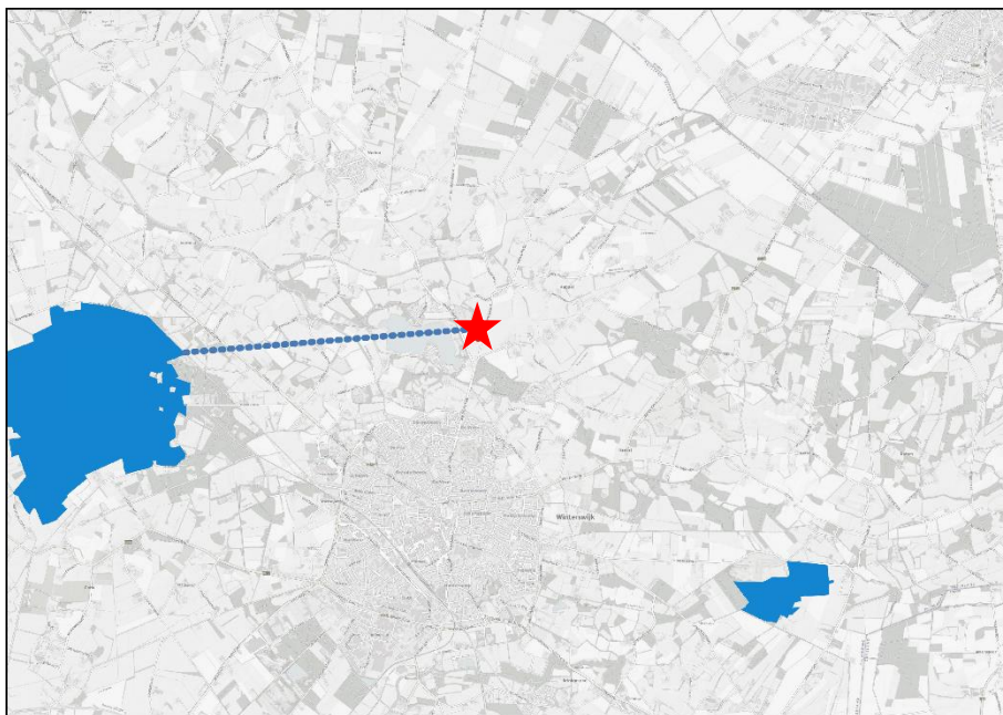
Figuur 5.1: Ligging van Natura 2000 in de omgeving van het plangebied (rode ster). Gronden die tot Natura 2000 behoren worden met de blauwe kleur op de kaart aangeduid.

Het plangebied ligt op minimaal 3.7 kilometer afstand van Natura 2000-gebied (Figuur 5.1). Het meest nabij gelegen Natura 2000-gebied is Korenburgerveen.