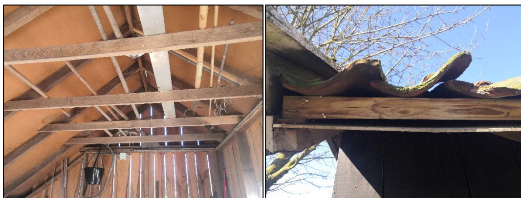
Figuur 2.5 (links): De binnenkant van de schuur; Figuur 2.6 (rechts): Het pannendak van de houten schuur heeft geen dakgoot, maar wel ruimte tussen de pannen en geen vogelschroot.