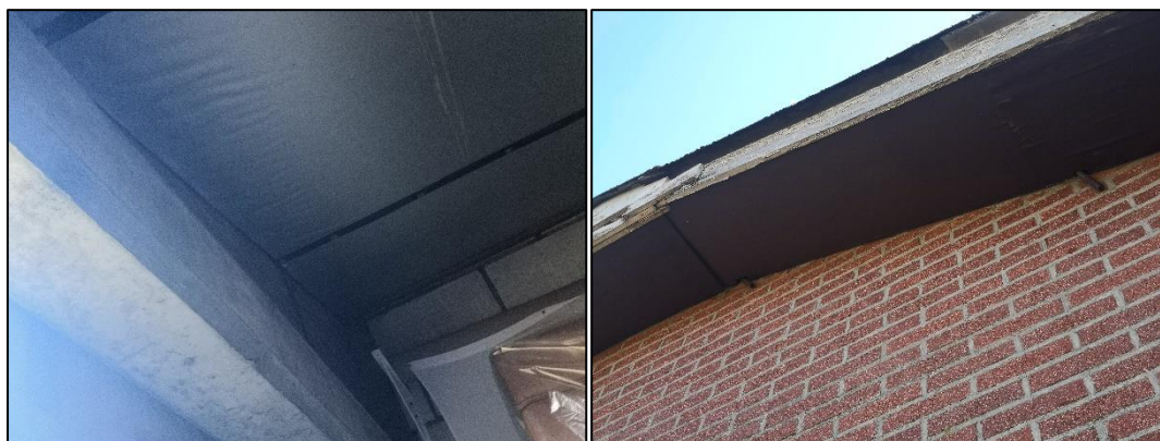
Figuur 2.11 (links): De binnenkant van de stalgebouwen is goed onderhouden, in de dakisolatie zijn geen gaten en/of kieren aangetroffen; Figuur 2.12 (rechts): Ook de daklijst van de meest zuidelijke gemetselde schuur bevatten geen kieren en sluiten goed aan.