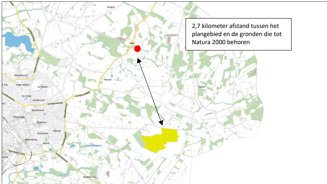
Ligging van Natura 2000-gebied in de omgeving van het plangebied. De ligging van het plangebied wordt met de rode stip aangeduid. Gronden die tot Natura 2000 behoren worden met de gele kleur aangeduid.