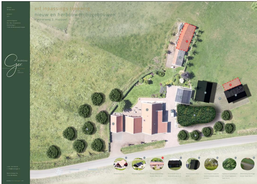
Plattegrond van het wenselijke eindbeeld.

Het voornemen bestaat de kapschuur te herbouwen, een nieuwe schuur te bouwen en de berging en het schuurtje te slopen. Nadien wordt het plangebied landschappelijk ingepast met diverse beplanting. Er wordt geen beplanting gerooid tijdens uitvoering van de voorgenomen activiteiten en overige bebouwing op het erf blijft onaangetaast. Op onderstaande afbeelding wordt de plattegrond van het wenselijk eindbeeld weergegeven.