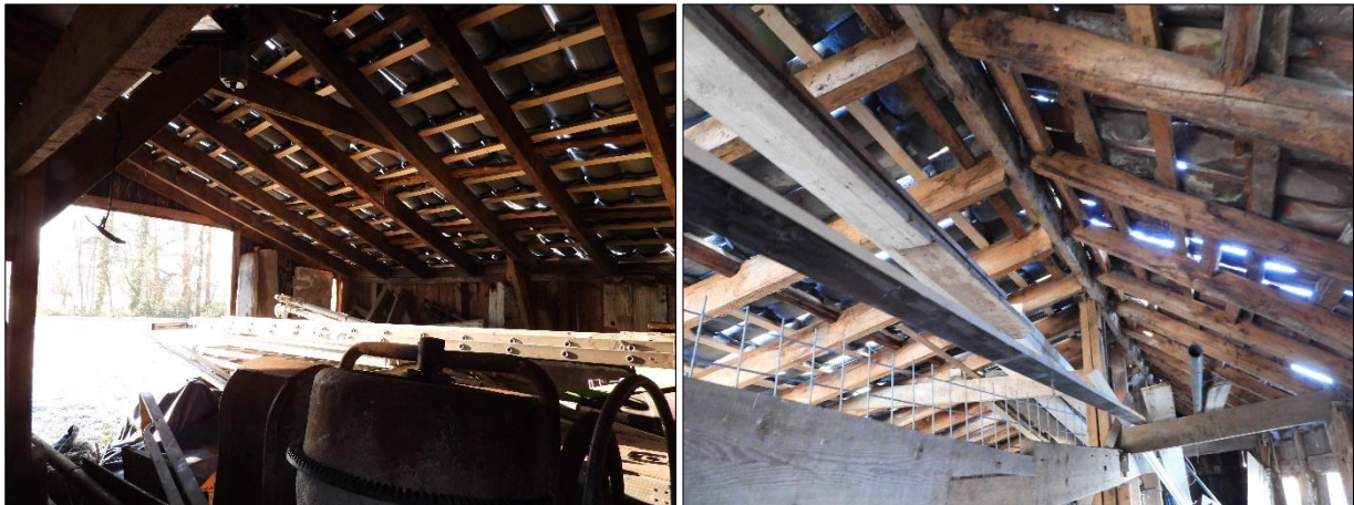
Potentiële nestlocatie van vogels in toegankelijke gebouwen.

Het plangebied behoort tot functioneel leefgebied van verschillende vogelsoorten. Vogels benutten het plangebied als foerageergebied en vermoedelijk nestelen er jaarlijks vogels in het plangebied. Vogels kunnen een nestlocatie bezetten in de gebouwen. Vogelsoorten die mogelijk in het plangebied nestelen zijn merel, roodborst, holenduif en witte kwikstaart. Er zijn tijdens het bezoek geen huismussen in het plangebied aangetroffen en er zijn geen geschikte nestlocaties voor deze soort aanwezig in de bebouwing; de met dakpannen gedekte gebouwen beschikken niet over een beschoten kap. Er zijn geen oude of potentiële nesten van roofvogels of uilen in de bebouwing of in beplanting in de omgeving van het plangebied waargenomen. Deze nesten zijn doorgaans gemakkelijk te vinden aan de hand van schijfsporen en braakballen. Het plangebied valt binnen het verspreidingsgebied van de steenuil maar er zijn geen aanwijzingen aangetroffen dat deze soort het plangebied benut als foerageergebied (NDF, 2022).