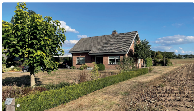
ZICHT OP DE VOORZIJDEN EN ZIJKANTEN WONING VANAF DE WEG