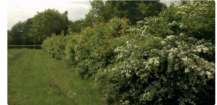
HEESTERBEGROEIING LANGS OPRIT (BLOEI/VRUCHTDRAGEND)