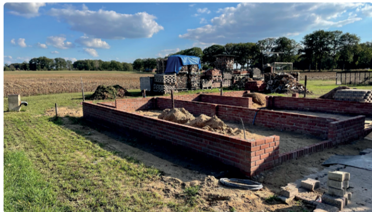
BETREFFENDE NIEUWE SCHUUR IN AANBOUW