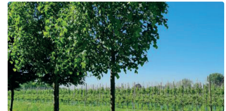
LINDES LANGS OPRIT, HERHALING