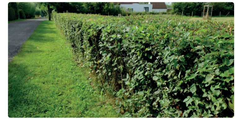
GEMENGDE HAAG MET BEUK, VELDEDOORN EN MEIDOORN