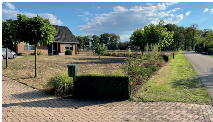
ZICHT VANAF OPRIT - VOORZIJDE WONING