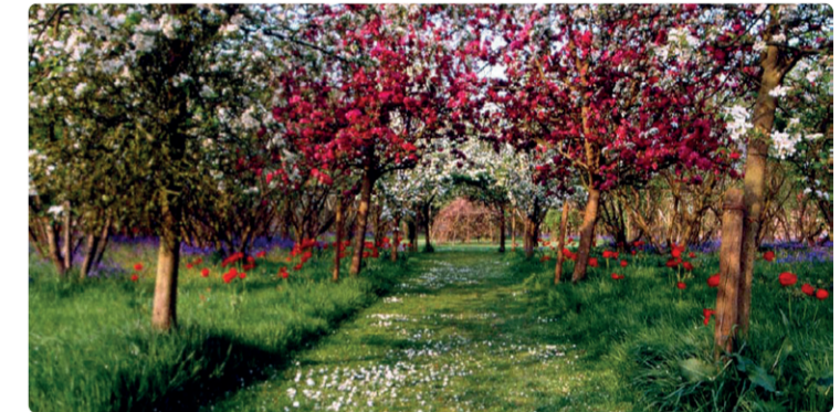
HOOGSTAM FRUITGAARD MET WALNOOT, APPEL EN KERS