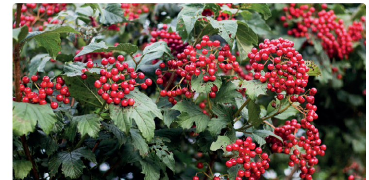
HEESTERBEGROEIING, VERGROTEN BIODIVERSITEIT