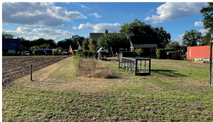
HUIDIGE TUIN - ACHTERZIJDEN WONING