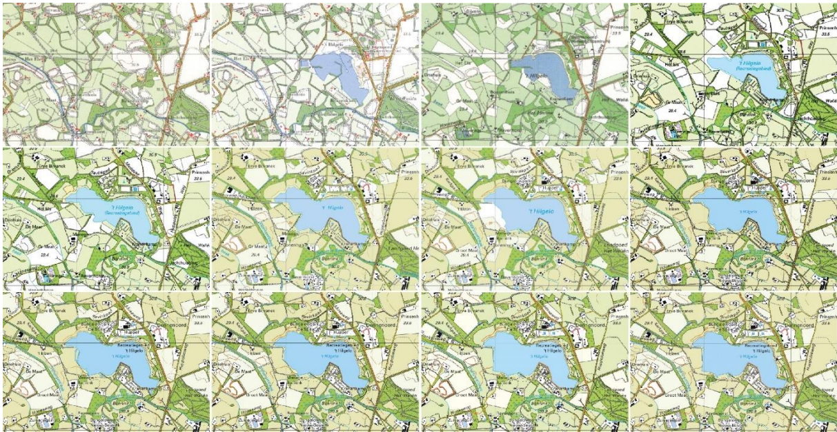
Figuur 1: Ontwikkeling Hilgelo van jaren '70 tot 2023

Voor de wijze waarop participatie is voorzien, zoals staat omschreven in het volgende hoofdstuk, is de achtergrond/historie en de functie van dit gebied van belang omdat nieuwe concepten/plannen hier op voortborduren en invulling aan geven.