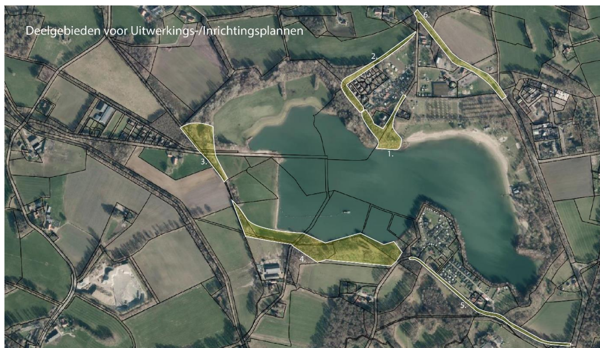
Figuur 2: Deelgebieden indicatief weergegeven op kaart