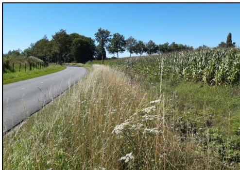
Berm en maisakker aan zuidwestkant van het plangebied