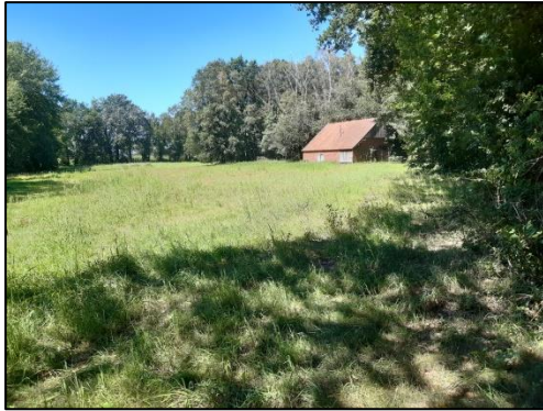
Plangebied gezien vanuit het zuiden