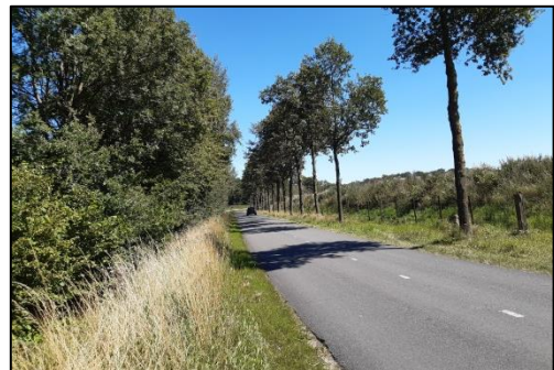
Houtwal en bomenrij langs de weg aan de zuidzijde van het plangebied.