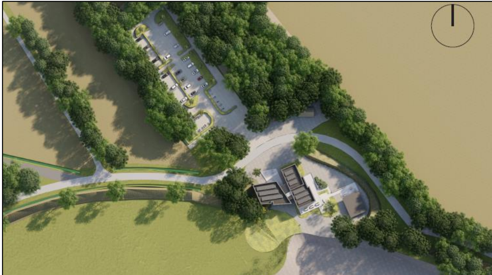
Impressie beoogde situatie plangebied

Om de ontwikkeling mogelijk te maken is een infrastructurele aanpassing noodzakelijk. De Steengroeveweg wordt verlegd en loopt in de gewenste situatie in een scherpe boog rondom het museum en het pyrietpaviljoen. Aan de overzijde van de weg, ter hoogte van de huidige agrarische percelen, wordt voorzien in parkeergelegenheid. De parkeergelegenheid wordt ingepast met hagen en groen, zodat het groene karakter van de omgeving niet in het geding komt.