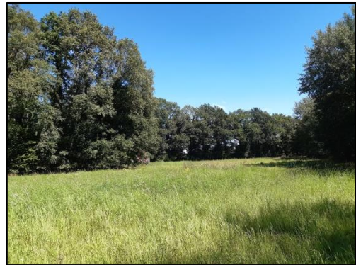
Plangebied gezien vanuit het noorden