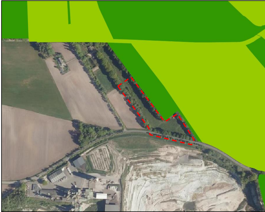
Globale ligging van het plangebied (rood kader) ten opzichte van het GNN (donkergroen) en de GO (lichtgroen).

De bescherming van het GNN kent niet het begrip externe werking. Aangezien het plangebied niet in de GNN of GO ligt, leidt de voorgenomen ingreep niet tot vermindering van de oppervlakte, kwaliteit of samenhang van de aanwezige natuur. De voorgenomen ingreep zal geen effect op de wezenlijke waarden en kenmerken van het Gelders Natuurnetwerk hebben. Wel grens het toekomstige parkeerterrein direct aan gronden met de aanduiding 'natte natuur'. Deze gronden zijn mede bestemd voor het behoud, het herstel en/of de ontwikkeling van natuurwetenschappelijke waarden in de vorm van natte natuur. Deze gronden zijn onderdeel van het GNN, behorend bij de vochtige bossen volgens het Natuurbeheerplan. In het landschap- en inrichtingsplan zal rekening gehouden moeten worden met de impact van de ontwikkeling op de ter plaatse aanwezige (natte) natuurwaarden. De bescherming van het Gelders Natuurnetwerk staat de uitvoering van het plan niet in de weg, mits rekening gehouden wordt met de Natte Natuur.