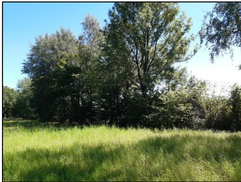
Houtwal aan de westrand van het plangebied