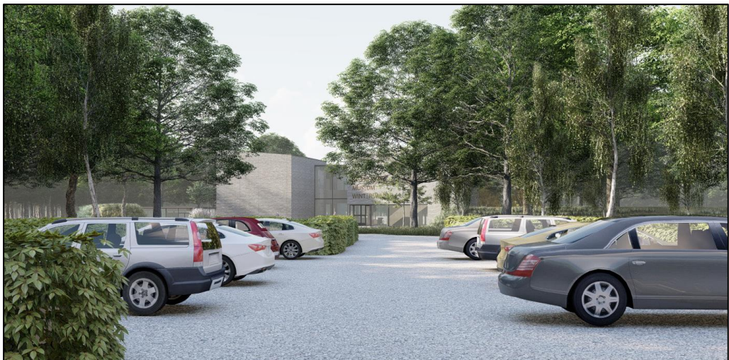
Impressie parkeerplaats met zicht op museum (bron: Maas Architecten)