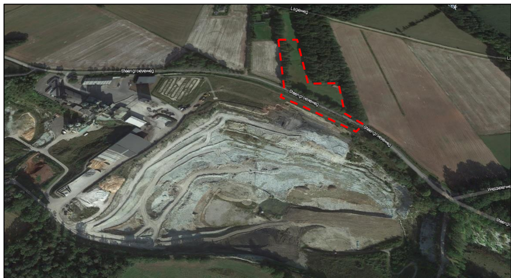
Impressie huidige situatie plangebied in vogelvlucht

Het deel van het plangebied aan de zijde van de steengroeve zelf betreft de buitenste rand van de groeve, welke zich op maaiveldniveau bevindt. De delen waar de kalkwinning plaatsvindt c.q. -vond vallen buiten het plangebied. Navolgende afbeelding geeft een impressie van de huidige situatie van het plangebied.