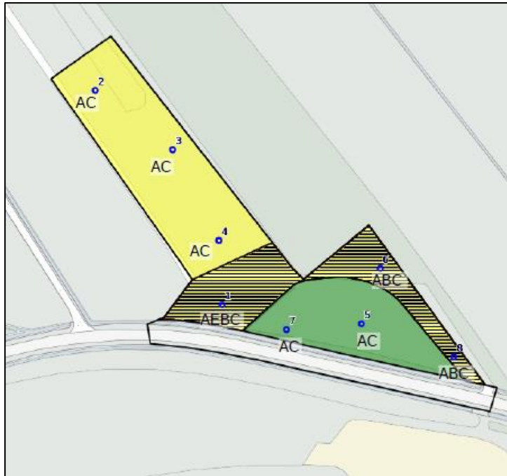
Resultaten booronderzoek, met nader te onderzoeken deel gearceerd

Op basis van de onderzoeksresultaten is besloten om voor de geel gearceerde gronden een archeologische dubbelbestemming op te nemen. Hierdoor kunnen zonder vervolgonderzoek geen werkzaamheden plaatsvinden dieper dan 30 centimeter onder het bestaande maaiveld. Met het opnemen van archeologische dubbelbestemmingen in het plangebied zijn eventuele archeologische waarden in het plangebied in voldoende mate beschermd.