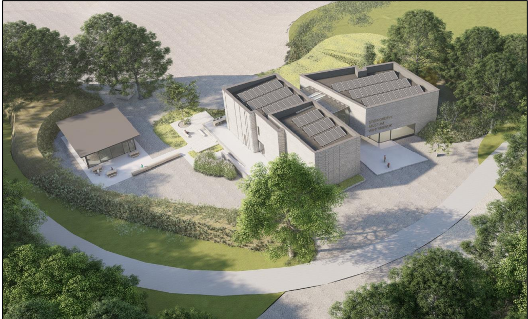
Overzichtsfoto ontwikkeling: rechts museum en links pyrietpaviljoen (bron: Maas Architecten)

Het museum krijgt ondanks een eenvoudige opzet een iconische uitstraling en wordt verbijzonderd met geologische referenties (onder andere spelonken, monolieten en zuilvormen). Het gebouw kan deels in de grond worden gebouwd en zal circa 10 meter hoog worden, gemeten vanaf het maaiveld. Het pyrietpaviljoen bevindt zich naast het museum en zal circa 3 meter hoog worden, gemeten vanaf maaiveld.