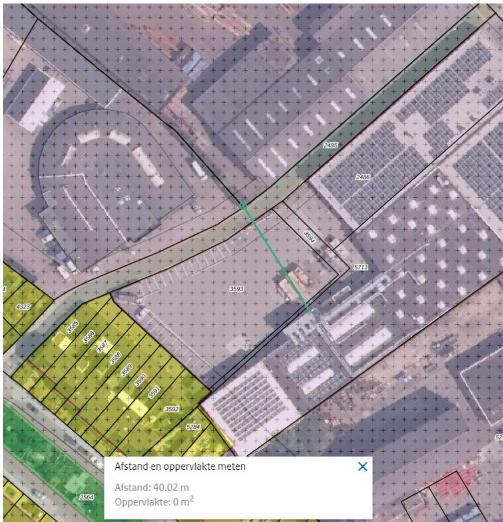
Figuur 6: overzicht afstand filtersysteem tot grens plangebied "Parallelweg Winterswijk".

Arco moet volgens de vigerende vergunning voldoen aan een geurbelasting van 1 \text{ ge}/\text{m}^3 of 0,5 \text{ oue}/\text{m}^3 op de gevel van de dichtstbijzijnde woning. De nieuwe woningen van de nieuwbouwwijk aan de Parallelweg liggen in het worstcasescenario verder van het emissiepunt af dan de bestaande woningen. De geurimmissie op de nieuwe woningen zal hierdoor lager zijn dan 0,5 \text{ oue}/\text{m}^3 , omdat de geur zich over deze afstand meer verspreidt en dus per \text{m}^3 lager zal uitvallen. Indien er gemeten wordt vanaf de grens van 'Parallelweg Winterswijk' tot aan het dichtstbijzijnde punt van het filtersysteem, is de afstand hetzelfde als die van de bestaande woningen. Hierdoor zal er geen sprake zijn van een slechter woon- en leefklimaat op de nieuwe locatie dan bij de bestaande woningen.