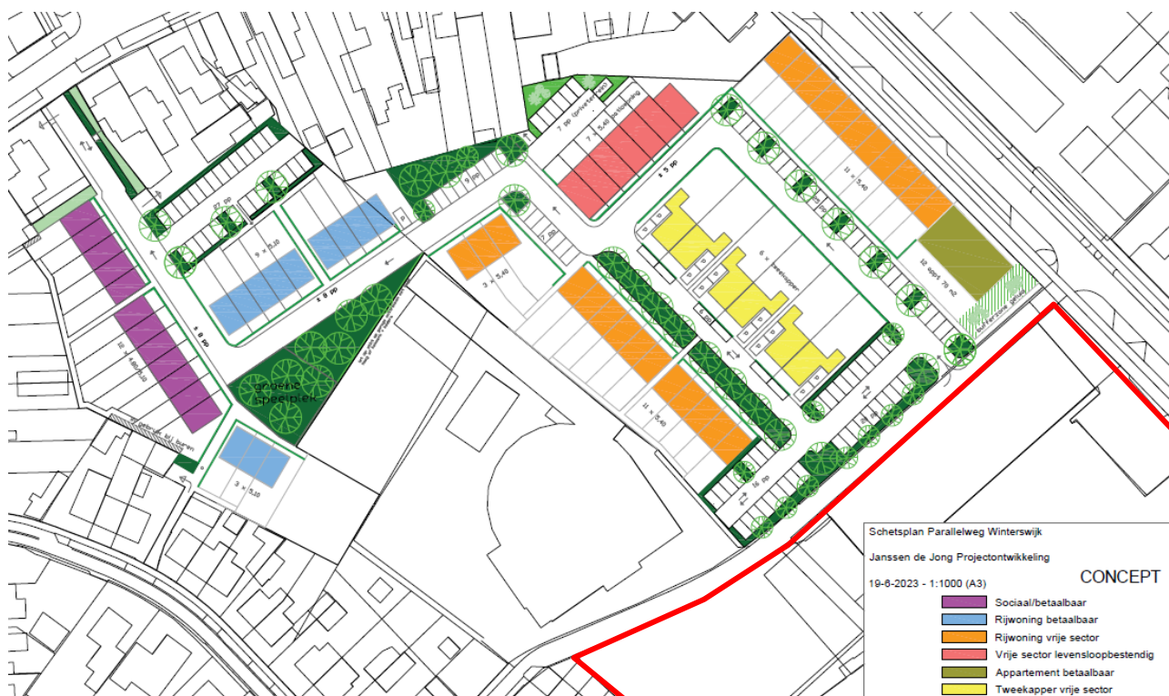
Figuur 1: overzicht beoogde woningen nieuwe ontwikkeling. Arco meubelfabriek is aangegeven in een rood kader.