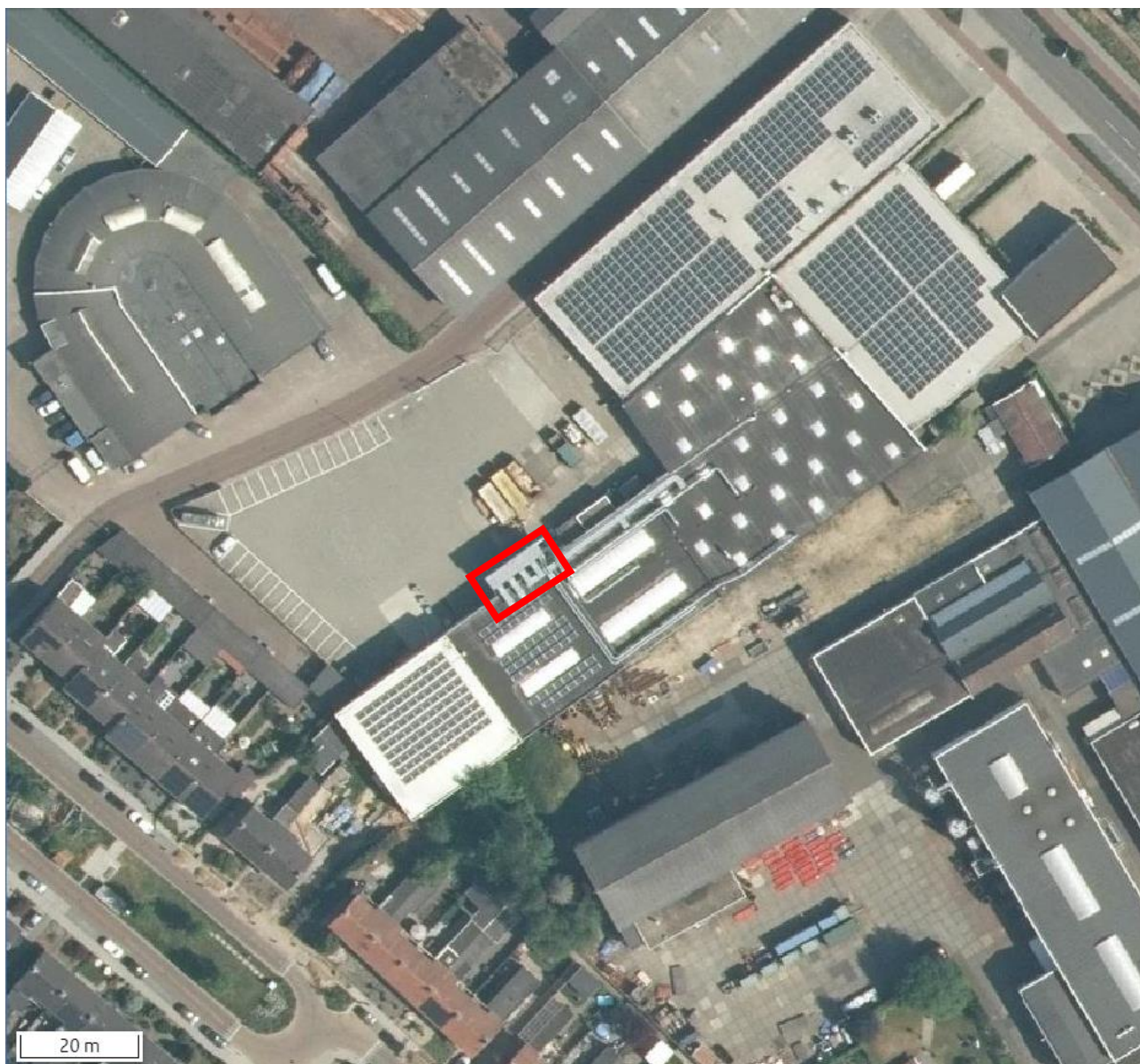
Figuur 3: Overzicht locatie Arco met dichtstbijzijnde bestaande woningen. Het filtersysteem is in rood kader weergegeven (Bron: Ruimtelijkeplannen.nl 16-8-2023).

Om van een worstcasescenario uit te gaan wordt de afstand tussen het bouwvlak van de dichtstbijzijnde woning Crocusstraat 26 en het uiterste punt van het filtersysteem gemeten. Deze afstand bedraagt circa 40 meter (zie figuur 4).