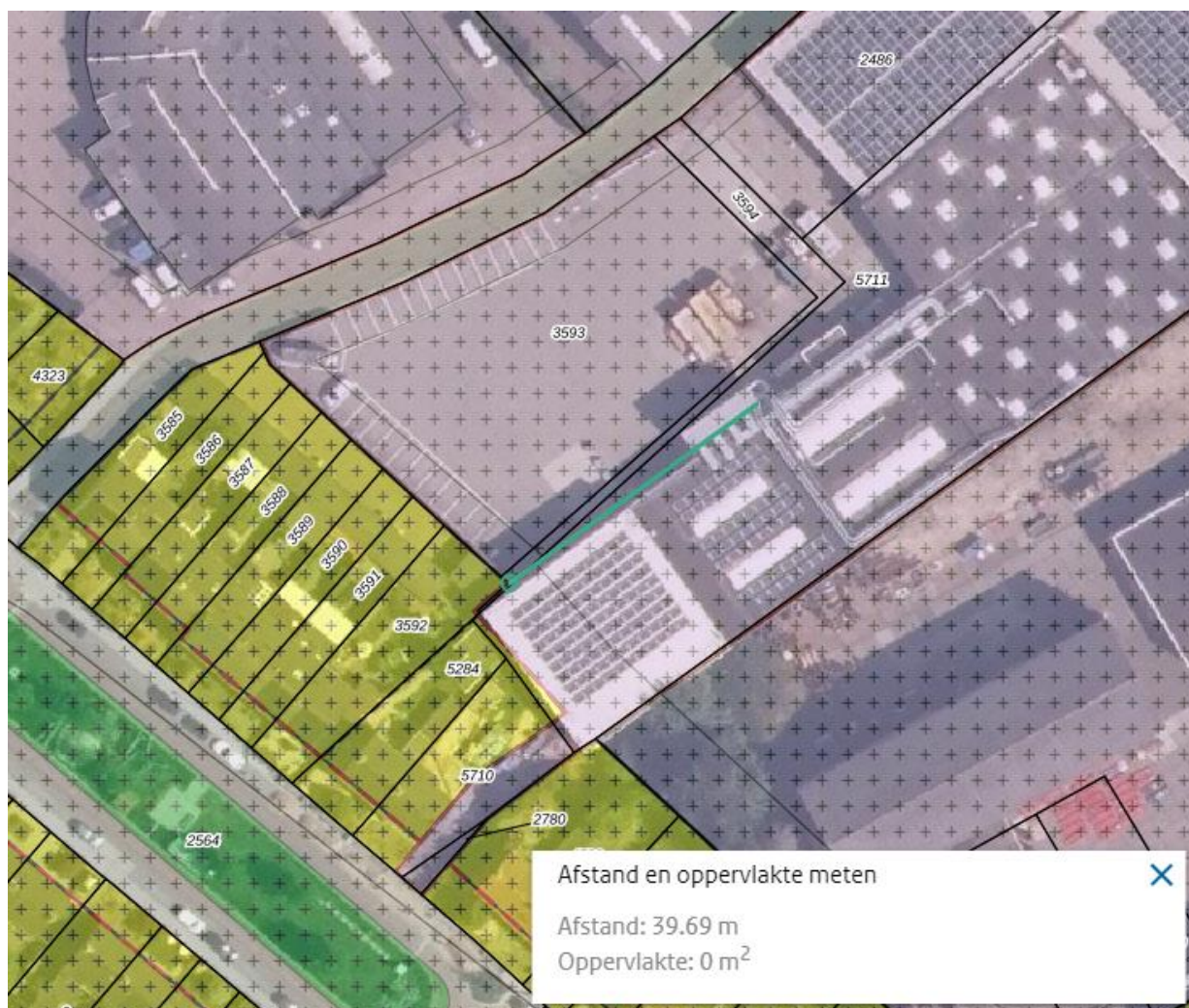
Figuur 4: Overzicht afstand van Crocusstraat 26 tot het verste punt van het filtersysteem Arco.

Hierna wordt er voor de nieuwe woningen uitgegaan van de afstand van het bouwvlak van de dichtstbijzijnde nieuwe woning tot het dichtstbijzijnde punt van het filtersysteem. Deze afstand bedraagt circa 56 meter (zie figuur 5). Indien er in een worstcasescenario wordt uitgegaan van de grens van project 'Parallelweg Winterswijk' tot aan de dichtstbijzijnde punt van het filtersysteem, bedraagt de afstand circa 40 meter (figuur 6).