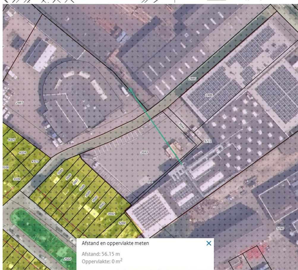
Figuur 5: overzicht afstand filtersysteem tot nieuwe woning. De rode pijl geeft het punt aan tot waar gemeten wordt.