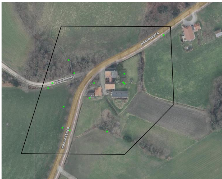
Weergave van bekende records in en rond het plangebied. Het zoekgebied wordt met het zwarte kader aangeduid. Waarnemingen worden met een groene stip aangeduid.

Op 3 april 2023 is de Nationale databank flora en fauna (NDF) geraadpleegd en is gekeken of waarnemingen van beschermde planten en dieren aanwezig zijn in de databank. In de NDF zijn 17 records opgenomen, welke betrekking hebben op het plangebied en een gebied rondom het plangebied. Op onderstaande luchtfoto wordt het zoekgebied weergegeven, waarbinnen gekeken is naar bekende waarnemingen. Tevens zijn alle bekende waarnemingen weergegeven met een groene stip op de luchtfoto.