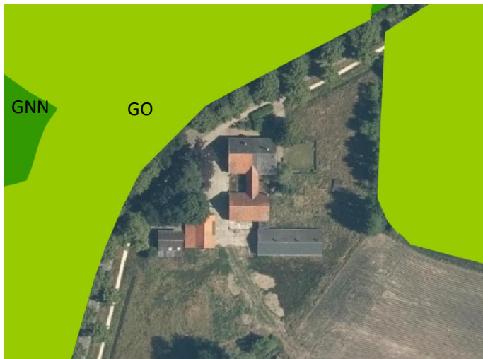
Ligging van Gelders Natuurnetwerk (GNN) in de omgeving van het plangebied. Gronden die tot de Groene Ontwikkelingszone (GO) behoren, worden met de lichtgroene kleur aangeduid, gronden die tot het Gelders Natuurnetwerk behoren worden met de donkergroene kleur aangeduid.

Het plangebied ligt buiten de begrenzing van het Gelders Natuurnetwerk en de Groene Ontwikkelingszone. Op onderstaande afbeelding wordt de ligging van het Gelders Natuurnetwerk en de Groene Ontwikkelingszone in de omgeving van het plangebied weergegeven.