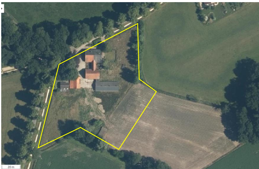
Luchtfoto van het plangebied, met tevens de begrenzing (gele lijn) aangeduid.

Het plangebied vormt een voormalig agrarisch erf, waar de agrarische bedrijfsactiviteiten al enige tijd gelden gestaakt zijn. Op het erf staan een boerderij en zes bijgebouwen, waaronder een schuur, varkensstal, kapschuur, werktuigenberging en twee kippenhokken. Het erf grenst aan de westzijde aan de Wooldseweg en aan de overige zijden aan agrarisch cultuurland. Rond de boerderij ligt een eenvoudige siertuin met gazon, buxushaag, taxus en een hoogstam fruitboom. Rondom de bebouwing ligt (verruigd) grasland. Ten westen van de boerderij staat een erfbosje zonder ondergroei. Op onderstaande afbeelding wordt de begrenzing van het plangebied weergegeven. Voor een verbeelding van de huidige situatie wordt verwezen naar de fotobijlage.