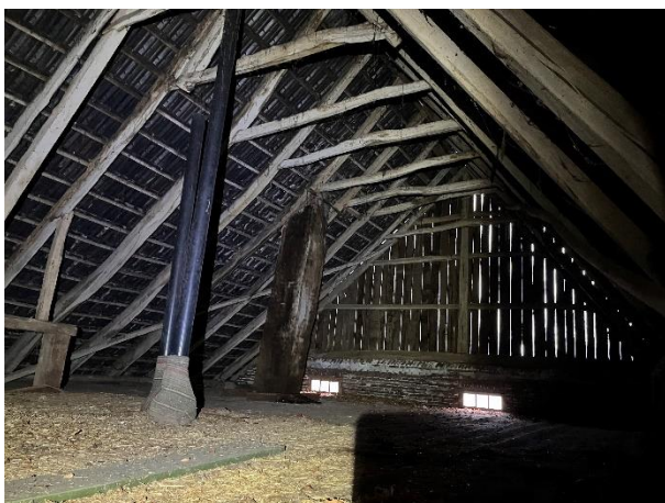
Aanzicht van de zolder van de boerderij. Deze zolder wordt mogelijk verbouwd.

De zolder van de boerderij is toegankelijk voor vleermuizen. De sporenkap is niet beschoten. Dergelijke plekken worden soms benut als rust- en verblijfplaats van gewone grootoorvleermuizen. De soort verraad zijn aanwezigheid echter door prooiresten of uitwerpselen op de bodem onder de hangplek. Er zijn op zolder echter geen sporen gevonden van vleermuizen.