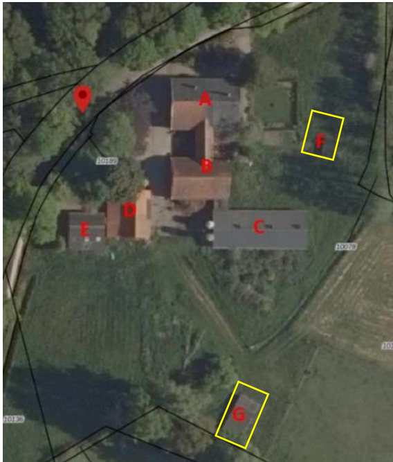
Aanduiding van de te slopen gebouwtjes (gele kader).

Op onderstaande afbeelding worden de twee te slopen bijgebouwen aangeduid.