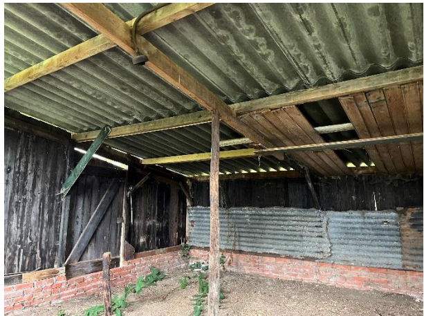
Aanzicht van beide te slopen gebouwtjes.

De zolder van de boerderij is toegankelijk voor vleermuizen. De sporenkap is niet beschoten. Dergelijke plekken worden soms benut als rust- en verblijfplaats van gewone grootoorvleermuizen. De soort verraad zijn aanwezigheid echter door prooiresten of uitwerpselen op de bodem onder de hangplek. Er zijn op zolder echter geen sporen gevonden van vleermuizen.