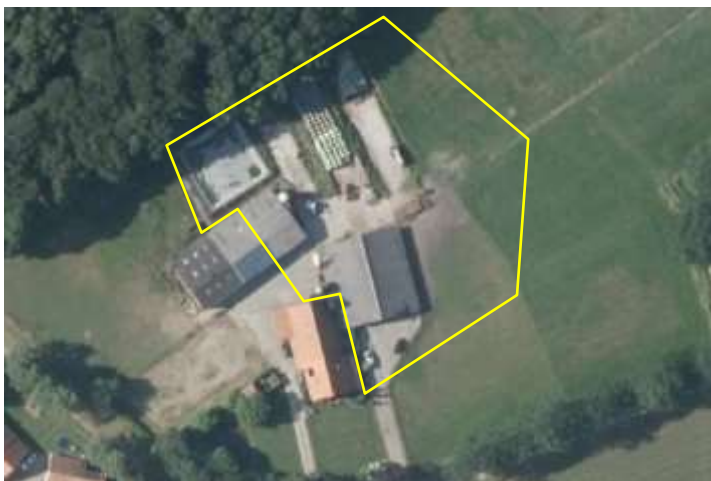
Detailopnames van het plangebied. De begrenzing van het plangebied wordt met de gele lijn aangeduid.

Het plangebied vormt een deel van een bestaand agrarisch bedrijf en bestaat uit bebouwing, erfverharding en agrarische cultuurgrond. In het plangebied staan een ligboxenstal en een werktuigenberging. Deze gebouwen zijn gebouwd van bakstenen en zijn gedekt met golfplaten. Alleen de ligboxenstal heeft een spouwmuur. Geen van de gebouwen beschikken over dakisolatie. Aan de achterzijde van het erf liggen twee kuilvoerplaten en een mestsilo. Rondom het erf ligt agrarische cultuurgrond, tijdens het veldbezoek in gebruik als grasland. Dit grasland bestaat uit een soortenarme vegetatie van hoofdzakelijk raaigras. Op onderstaande afbeelding wordt een luchtfoto van het plangebied weergegeven, evenals de begrenzing van het onderzoeksgebied. Voor een impressie van het plangebied wordt verwezen naar de fotobijlage.