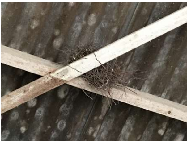
Oude nest van een houtduif in de kapschuur.

Het plangebied behoort tot functioneel leefgebied van verschillende vogelsoorten. Vogels benutten het plangebied hoofdzakelijk als foerageergebied, maar mogelijk nestelen er incidenteel vogels in de gebouwen. Er is een oud nest van de houtduif aangetroffen in de kapschuur. In de loopstal zijn geen (oude) vogelnesten aangetroffen. Vogelsoorten die mogelijk in de gebouwen nestelen zijn hout- en holenduif. Tijdens het veldbezoek zijn 5 huismussen waargenomen in de loopstal. Deze nestelen volgens de eigenaar onder de dakpannen van de boerderij net buiten het plangebied. Er zijn in de loopstal en werktuigenberging geen oude nesten van de huismus waargenomen en er zijn geen potentiële nestplaatsen van de huismus in de gebouwen waargenomen. Ook is geen steen- of kerkuil in de gebouwen waargenomen en zijn geen sporen gevonden die op het gebruik van de gebouwen door deze soorten duiden, zoals braakballen of schijfstrepen.