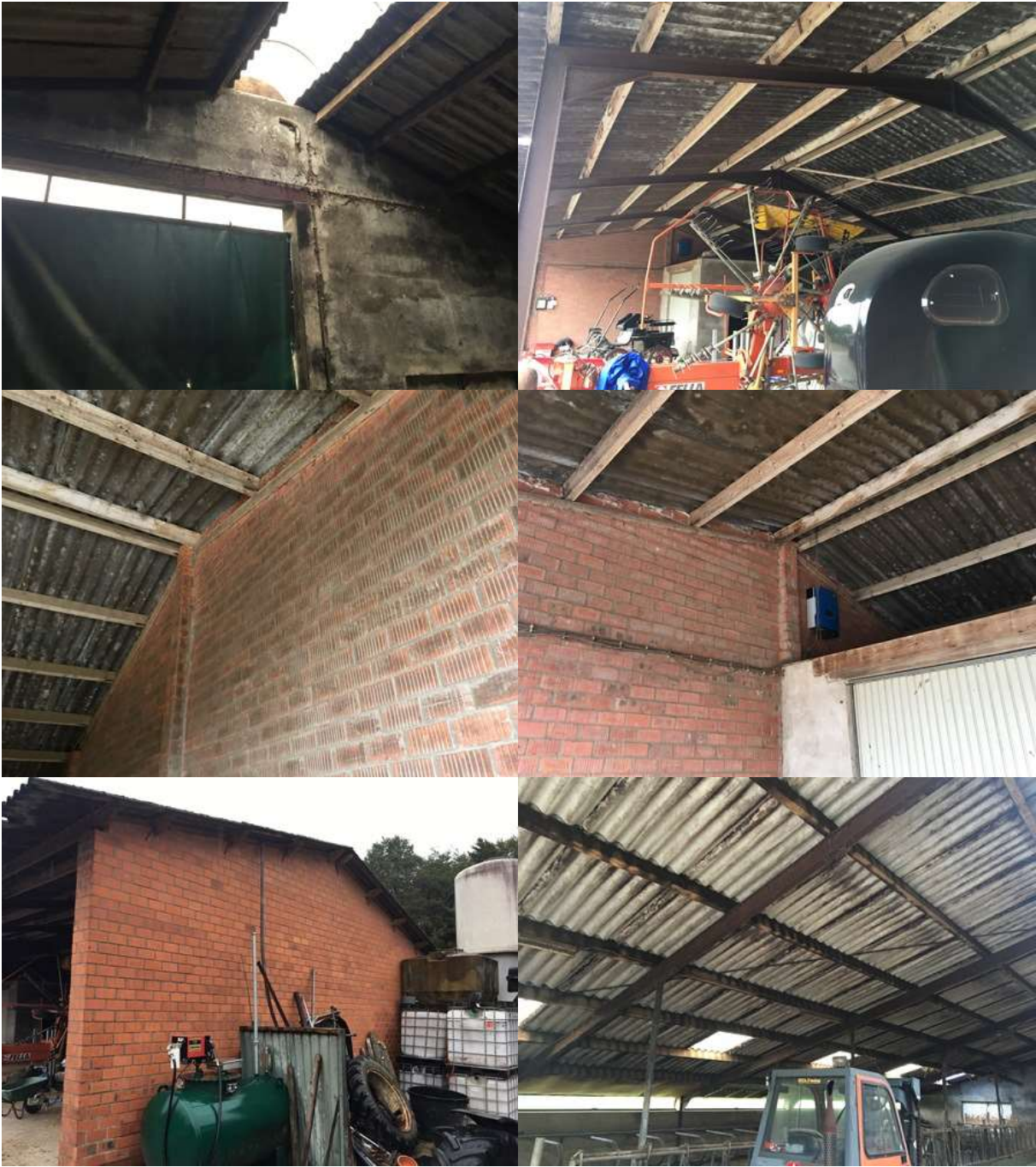
Bijlage 3. Fotobijlage. Impressie van het plangebied en de directe omgeving.