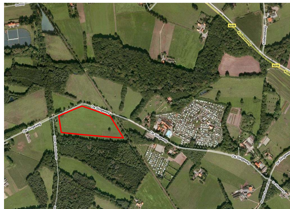
Ligging van de uitbreidingslocatie

In totaal worden met de uitbreiding circa 400 extra plaatsen gecreëerd. Afgezet tegen het verlies van naar schatting 250 plaatsen op het huidige terrein, neemt het totale aantal plaatsen naar verwachting met 299 plaatsen toe. Dit betekent netto een stijging van circa 25% van de huidige capaciteit van recreatiecentrum Het Winkel die de gezinsverdunding uit het verleden compenseert.