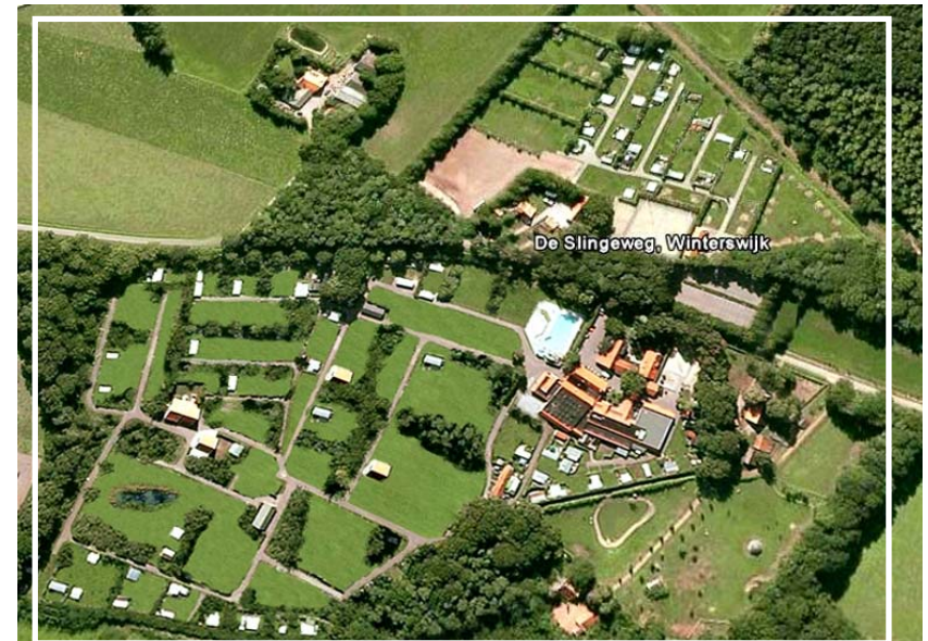
animatie van de kwaliteitsverbetering