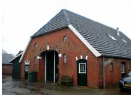
De deel van de karakteristieke boerderij aan het binnenerf

De boerderij is een karakteristiek pand met wolfseind. Als je het erf op rijdt via de 'schone weg' kom je eerst de deel tegen, het woongedeelte kijkt uit op het landschap. De deel, die als eerste in het oog springt als je het erf op komt, heeft een prachtige entree met ronde staldeuren. De (paarden)stal is recent gebouwd en heeft de vorm van een kapschuur: een hoge open voorkant en een lage achterkant met lange kap.