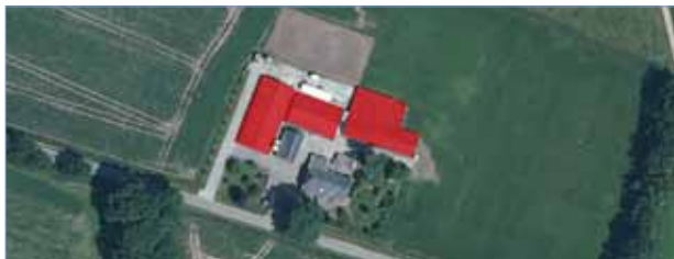
Te slopen bebouwing