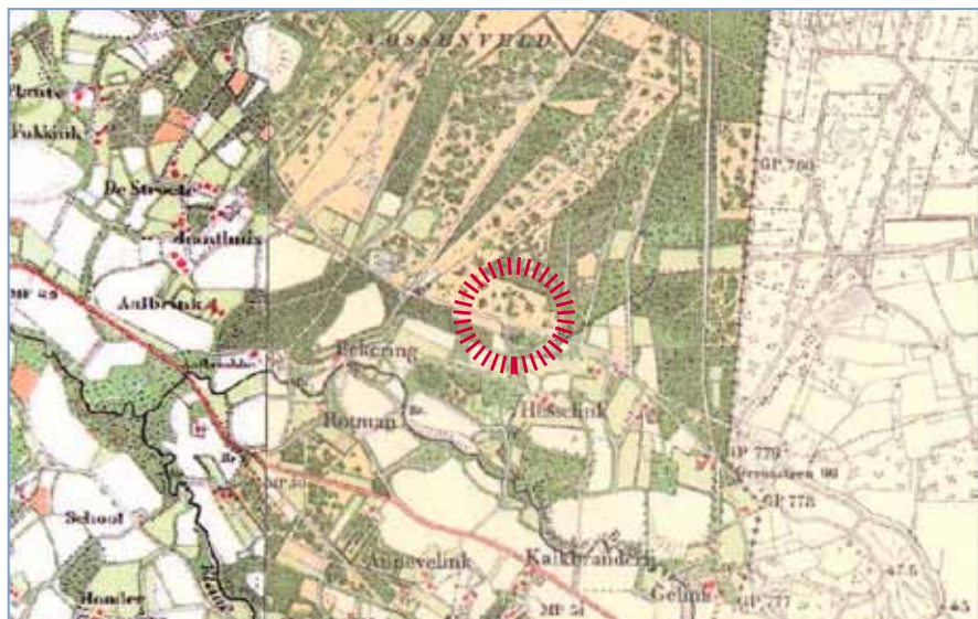
Locatie op historische kaart rond 1900: heide, links op de kaart de oude ontginningen