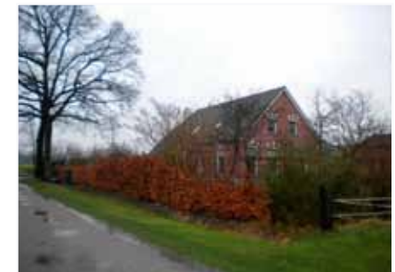
Siertuin aan de voorkant van de boerderij