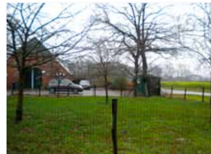
Fruitbomen op wekje langs de weg

Het woongedeelte van de karakteristieke boerderij, met de siertuin, is een beeld wat nadrukkelijk vanaf de weg in het oog moet (blijven) springen. Bij de positionering van de nieuwe woning moet hier rekening mee worden gehouden. De deel kant met de kapschuur rond de entree, de referentie naar het agrarisch verleden van het erf, dienen ook als zodanig herkenbaar te blijven.