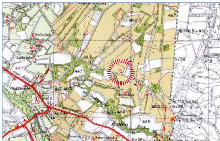
Locatie op historische kaart rond 1930: tussen 1900 en 1930 is de heide ontgonnen. Jonge ontginningen zijn rationeler ingericht dan oude landschappen