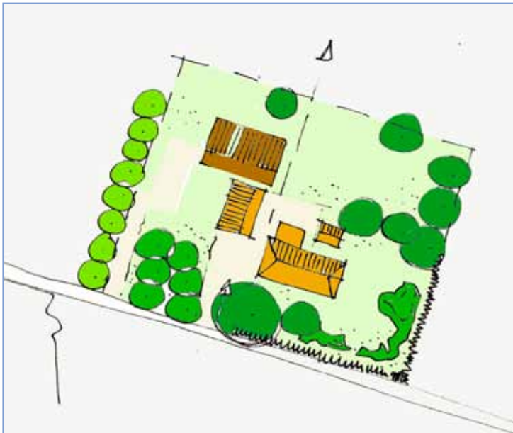
Vertaling van de hoofdpunten in een mogelijke inrichtingschets, binnen de hoofdpunten zijn meerdere mogelijke ontwerpen denkbaar. In de schetsen is het donkere gebouw de nieuwe woning