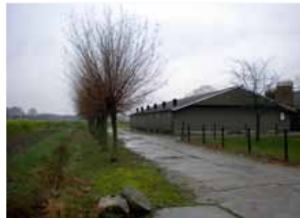
Zicht langs de 'vuile weg'