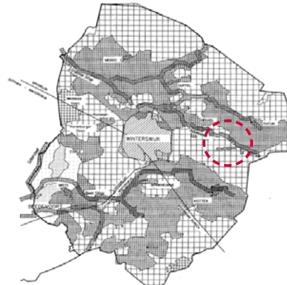
Landschapstype: jonge heide en broekontginninglandschap (LOP Winterswijk)

Doelstelling uit het landschapsbeleid (LOP) is om de identiteit van het landschap te versterken. In dit geval de kenmerken van het jonge heide- en broekontginningen landschap: lange lijnen, grote schaal, bebouwing langs de weg.