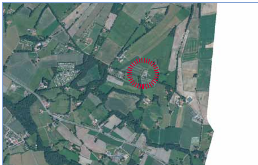
Locatie op luchtfoto: van boven af zie je dat het gebied armer is aan landschapselementen dan de oude hoevenlandschappen ten zuiden en westen