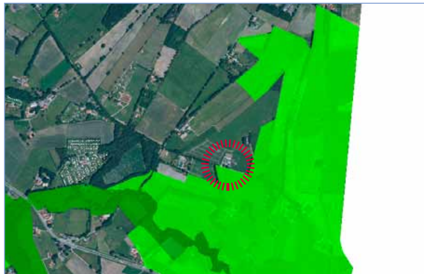
Ligging van het plangebied t.o.v. de ecologische hoofdstructuur (groen). Licht groen is het verweingsgebied