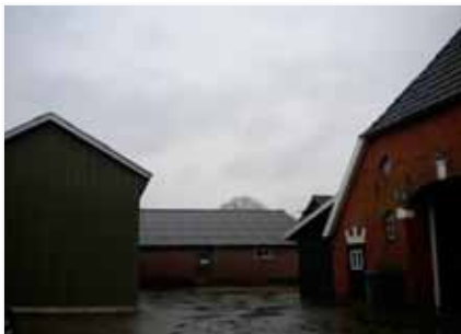
Het binnenerf heeft een stenige kern, geen relatie met het landschap

De hoofdpunten of 'spelregels' voor de ontwikkelingen op deze plek geven een kader voor de ontwerpfase. Binnen de hoofdpunten zijn verschillende ontwerpen denkbaar. Het advies is om hiervoor een integraal ontwerp te (laten) maken van de erfinrichting én de architectuur van de gebouwen.