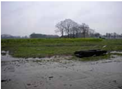
Vergezicht vanaf achtererf

Het erf is gelegen in een jonge ontginningslandschap, op de rand van het kampenlandschap. Op de kaart uit 1900 is te zien dat dit gebied nog heide was terwijl andere delen, in het zuidwesten, al in ontginning waren genomen. Normaal gesproken hebben jonge ontginningen een heel herkenbare, rationele, grootschalige verkaveling met minder groenelementen dan de oude landschappen. Door het reliëf is dat hier veel minder expliciet. Op de plattegrond is wel te zien dat er minder groenelementen voorkomen en de verkaveling wat grootschaliger en rechthoekiger is maar in het veld blijft het een aan doen als een kleinschalig, min of meer besloten landschap. Het relatieve vergezicht vanaf het erf naar het noordoosten, waardoor het landschap net iets meer van zich laat zien dan op andere plekken is daarom een bijzonder waardevolle kwaliteit. Hier moeten we gebruik van maken bij de locatie keuze van de nieuwe woning (orientatie op het open landschap) en bij de inrichting van de randen (zicht op het landschap mogelijk maken).