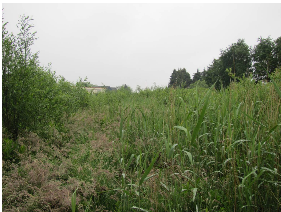
Figuur 3. Braakliggend terrein in de zuidpunt van het plangebied.