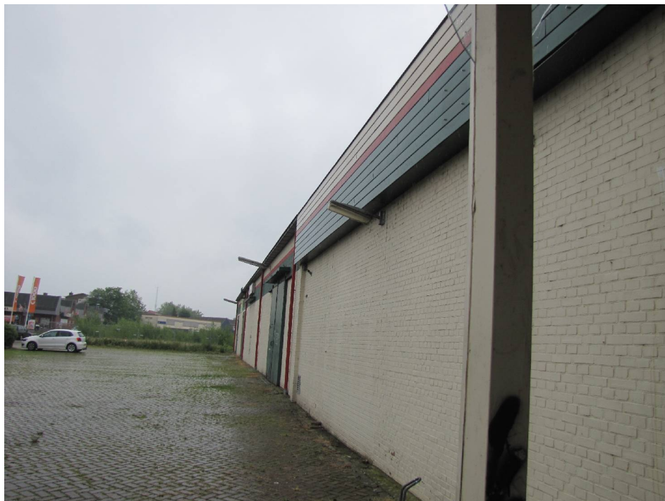
Figuur 2. Oostgevel van het te slopen pand, met gevelbetimmering.