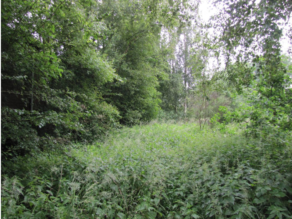
Figuur 4. Groenstrook tussen het te slopen pand en de spoorlijn Arnhem - Winterswijk