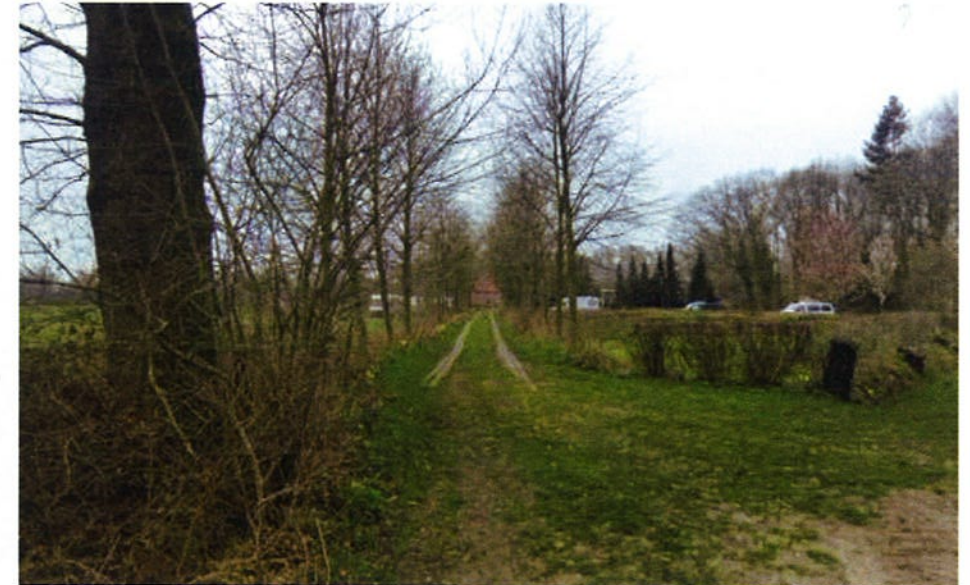
Afbeelding: Zicht op de camping vanaf de Kremerweg

Op de foto rechtsonder is de toegangsweg tot het campinggedeelte te zien vanaf de Kremerweg. Aan de rechterkant van de bomenlaan liggen de huidige standplaatsen. Aan de linkerkant hiervan ligt de gewenste uitbreidingslocatie.