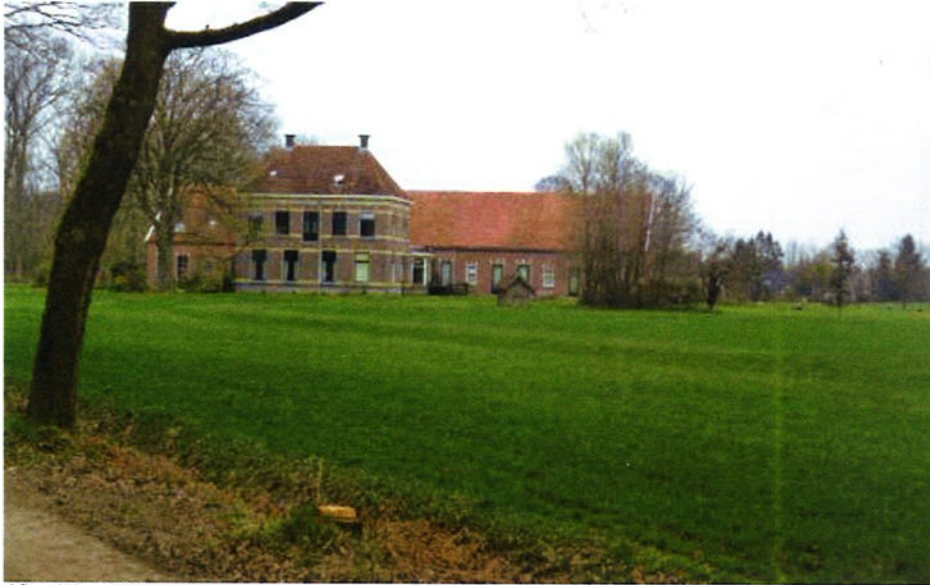
Afbeelding: Zicht op Lutje Kössink vanaf de Dondergoorweg

De bebouwing op Lutje Kössink bestaat uit een langgerekte boerenschuur met daar aan gekoppeld een voornaam voorhuis. Daarnaast is er nog boerenschuur aanwezig.