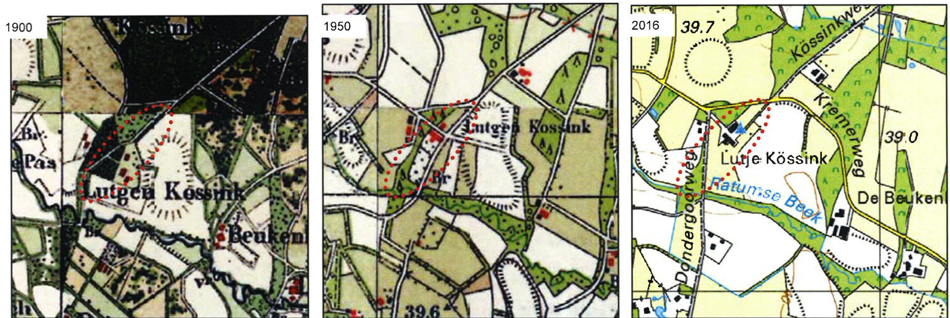
Afbeeldingen: Historische topografische kaarten. rode stippellijn geeft het plangebied aan.