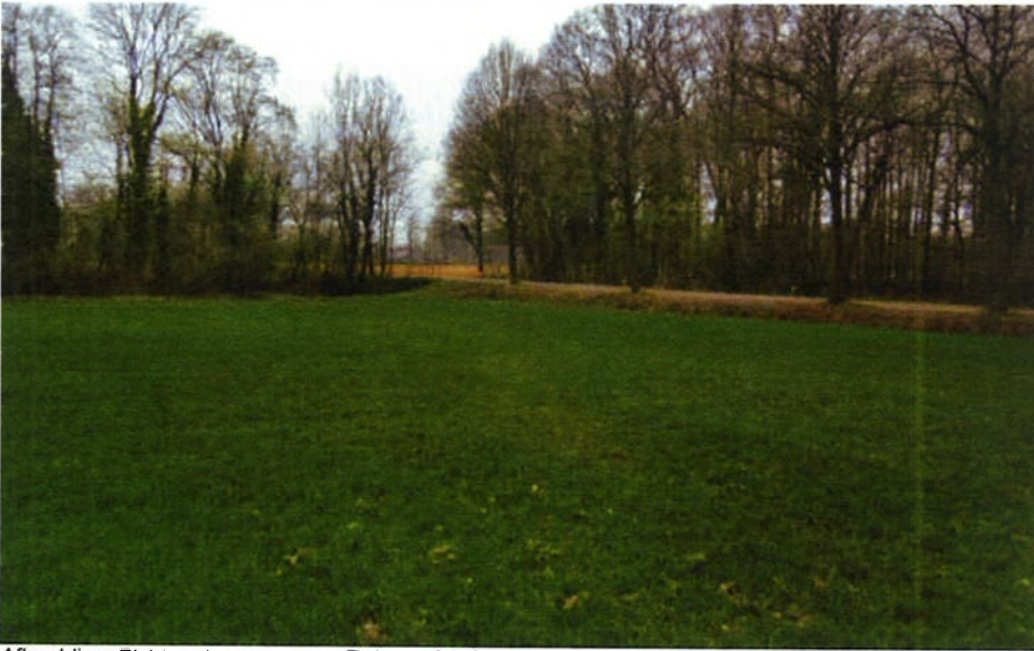
Afbeelding: Zicht op bosomgeving Ratumsebeek met rechts de Dondergoorweg.

Op de foto's onder is het ten zuiden van Lutje Kössink gelegen beekbegeleidende bos rond de Ratumse beek te zien.