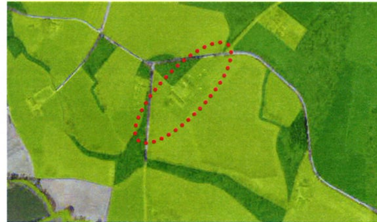
Afbeelding: GNN en GO provincie Gelderland