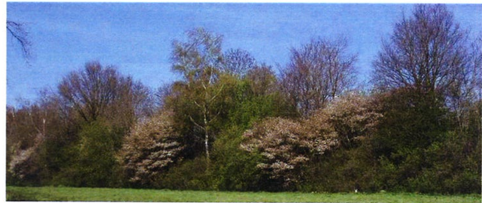
Foto boven. Streefbeeld houtsingel

Een alternatief voor deze vorm van beheer is het inzaaien van een rand aan de zuidzijde van de boomgaard van minimaal 5 meter met een bloeiend akkermengsel.