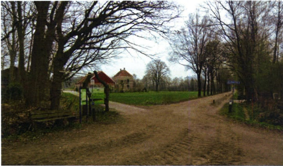
Afbeelding: Zicht op Lutje Kössink vanaf de toegangsweg