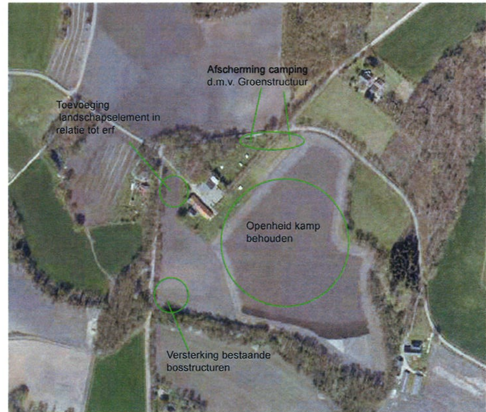
Afbeelding: uitgangspunten inpassing en compensatie.

Resultaat is een landschappelijke inpassing die aansluit bij de historische ontwikkelingen en het landschapstype, waarbij de natuurwaarden worden versterkt. Daarnaast wordt de visuele impact van de camping verkleint.