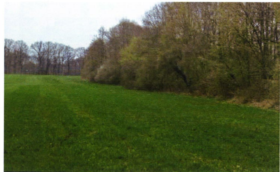
Afbeelding: Zicht op bosomgeving Ratumsebeek.