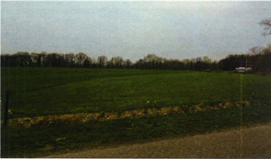
Afbeelding: Zicht op de gewenste uitbreidingslocatie van de camping vanaf de Kremerweg.

Op de foto linksboven is het veld te zien met de gewenste uitbreidingslocatie (het gemaaide deel).