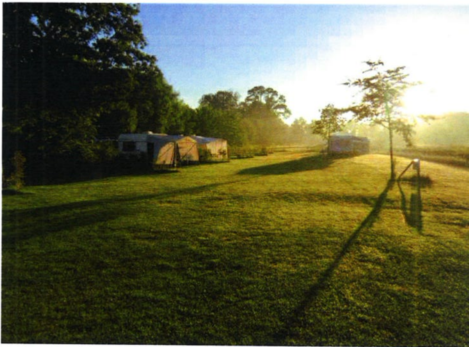
Afbeelding: Camping huidige situatie.

Op de locatie Kremerweg 6 in Winterswijk-Henxel is het natuurkampeerterrein (de minicamping) 'Lutje Kossink' van de heer Tenkink gevestigd. De camping is gesitueerd op de grond horende bij de herenboerderij Lutje Kossink. De boerderij is, naast woonhuis, ingericht als groepsaccommodatie. In de huidige situatie is de functie aanduiding kleinschalig kamperen, waarbij het aantal stapplaatsen 25 betreft. De heer Tenkink wil het aantal stapplaatsen uitbreiden naar 40 stapplaatsen. Voor deze uitbreiding is een wijziging van de huidige bestemming nodig naar bestemming camping. Een van de voorwaarden voor deze bestemmingsplanwijziging is een landschappelijke inpassing waarbij er duidelijk sprake is van (natuur)compensatie voor het gebruik van de gronden als camping. In dit rapport wordt deze landschappelijke inpassing en compensatie beschreven.