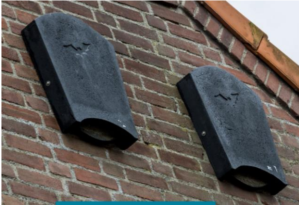
Voorbeeld van een vleermuiskast aan de gevel.