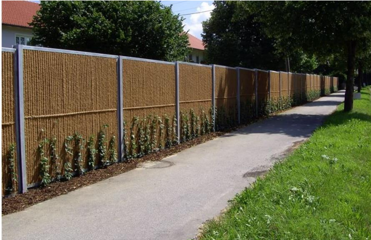
Schutting met hедера