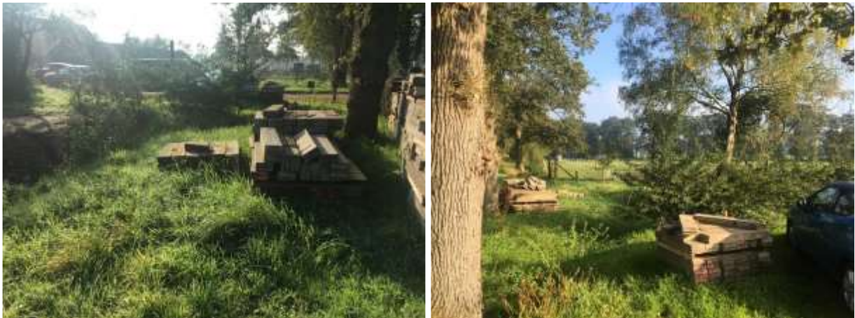
Amfibieën kunnen een (winter)rustplaats bezetten onder materialen/spullen verspreid in de buitenruimte

Tijdens het veldbezoek zijn geen amfibieën waargenomen, maar gelet op de inrichting en het gevoerde beheer, wordt het plangebied als functioneel leefgebied voor sommige algemene en weinig kritische amfibieënsoorten beschouwd. Amfibieën als bruine kikker en gewone pad benutten het plangebied als foerageergebied en mogelijk bezetten ze er een (winter)rustplaats. Deze soorten kunnen een (winter)rustplaats bezetten in hopen en gaten in de grond en onder opgeslagen materialen/spullen en onder strooisel en bladeren. De bebouwing is voor amfibieën niet toegankelijk om te betreden en daardoor niet geschikt om een (winter)rustplaats in te bezetten. Het plangebied wordt niet als functioneel leefgebied van zeldzame amfibieënsoorten als kamsalamander, rugstreeppad of poelkikker beschouwd. Geschikt voortplantingsbiotoop ontbreekt in het plangebied.