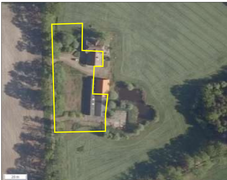
Luchtfoto van het het plangebied.

Het plangebied bestaat uit bebouwing, beplanting, agrarisch cultuurland, grasland, erfverharding en er liggen materialen verspreid in de buitenruimte (bestaande uit betonblokken, (bak)stenen, hout en bouwmaterialen). De bebouwing bestaat uit een woning, een stal en een aanbouw van een schuur. Alle bebouwing beschikt over gemetselde buitengevels. De stal beschikt niet over luchtsponw de overige bebouwing wel. De woning beschikt over een dakpannen gedekt dak en de stal en de aanbouw van de schuur zijn gedekt met golfplaten. De beplanting bestaat uit enkele struiken en loofbomen (o.a. eik en berk). Het grasland vormt grotendeels een weiland en bestaat uit een soortenarme vegetatie dat intensief wordt beheerd. Het agrarisch cultuurland, tijdens het veldbezoek in gebruik als grasland, bestaat ook uit een soortenarme vegetatie dat intensief wordt beheerd. Op onderstaande luchtfoto is de begrenzing van het plangebied aangegeven. Voor een impressie van het plangebied wordt verwezen naar de fotobijlage.