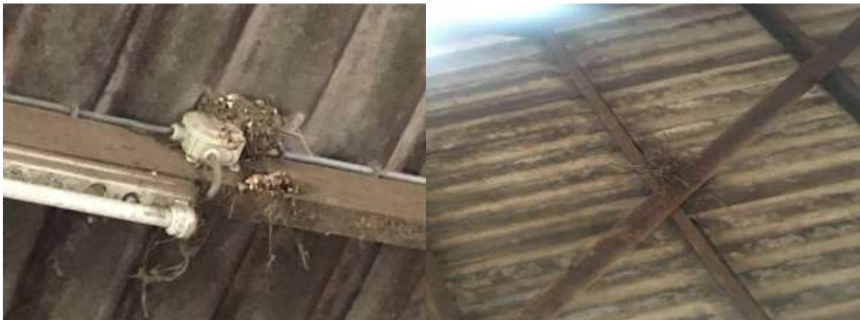
Foto links: Boerenzwaluw nest in stal, Foto rechts: Oud nest van houtduif in de stal

Het plangebied behoort tot functioneel leefgebied van verschillende vogelsoorten. Vogels benutten het plangebied als foerageergebied en vermoedelijk nestelen er jaarlijks vogels in het plangebied. Vogels kunnen een nestelen in de beplanting en in de stal. De stal beschikt over invliegopeningen en is daardoor toegankelijk voor vogels om in te nestelen. De overige bebouwing beschikt niet over invliegopeningen. Het intensief beheerd agrarisch cultuurland vormt geen nestplaats voor (weide)vogels maar dient wel als foerageergebied voor tal vogels die foerageren in het open, agrarisch cultuurland. Vogelsoorten die mogelijk in het plangebied nestelen zijn merel, winterkoning, holenduif, roodborst, houtduif, vink en zwartkop. Er zijn geen huismussen en oude nesten van huismussen in het plangebied waargenomen. Er zijn in het plangebied geen aanwijzingen gevonden dat steen- of kerkuil er een vaste rust- of nestplaats bezetten. Aanwezigheid van deze soorten in gebouwen is doorgaans gemakkelijk vast te stellen aan de hand van braakballen en schijtsporen en ruiveren. Tevens zijn geen aanwijzingen dat roofvogels een vaste rust- of nestplaats in het plangebied bezetten.