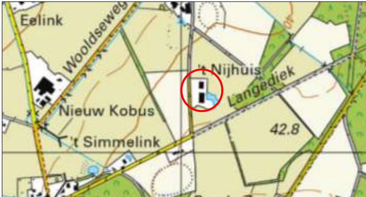
Globale ligging van het plangebied. De ligging van het plangebied wordt met de rode cirkel aangeduid (bron: ruimtelijkeplannen.nl).

Het plangebied is gesitueerd aan de Langediek 3 te Woold, gemeente Winterswijk. Het ligt circa 1,5 kilometer ten zuidwesten van de woonkern Woold en wordt omgeven door landelijk gebied. Op onderstaande afbeelding wordt de globale ligging van het plangebied weergegeven op een topografische kaart.