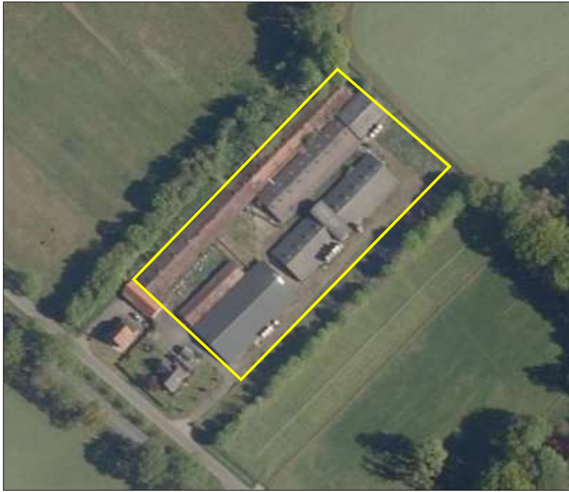
Begrenzing van het plangebied; deze wordt met de gele lijn aangeduid.