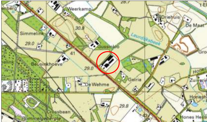
Globale ligging van het plangebied. De ligging van het plangebied wordt met de rode cirkel aangeduid.

Het plangebied is gesitueerd aan de Groenloseweg 104 te Winterswijk. Het ligt circa 1 kilometer ten noordwesten van de woonkern Winterswijk en wordt omgeven door landelijk gebied. Op onderstaande afbeelding wordt de globale ligging van het plangebied weergegeven op een topografische kaart.