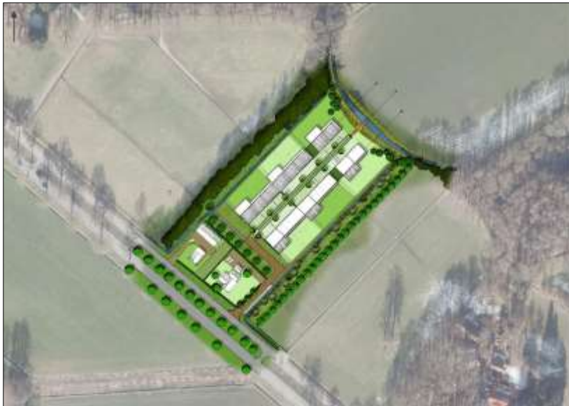
Verbeelding van het wenselijk eindbeeld (bron: VanWestreenen).

Het voornemen bestaat om alle bebouwing in het plangebied te slopen en vervangende nieuwbouw van woningen te realiseren. Aangenomen wordt dat alle aanwezige beplanting en de veevoedersilo's in het plangebied verwijderd worden. Tevens wordt aangenomen dat een deel van de erfverharding verwijderd en vervangen wordt en dat de nieuwe woningen d.m.v. nieuw aan te leggen paden in verbinding worden gebracht met het woenerf. Rondom de nieuwe woningen wordt gazon gelegd en het plangebied wordt nadien landschappelijk ingepast door middel van de aanplant van erfbeplanting. Op onderstaande afbeelding wordt een plattegrond van het wenselijk eindbeeld weergegeven.