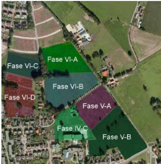
Figuur 1: globale ligging plangebied

De gezamenlijke opgave is om in 2009 te komen tot een bouwtitel voor de ongeveer 60 woningen in fase vijf-B van de in totaal 300 woningen voor de gehele fase V en VI.