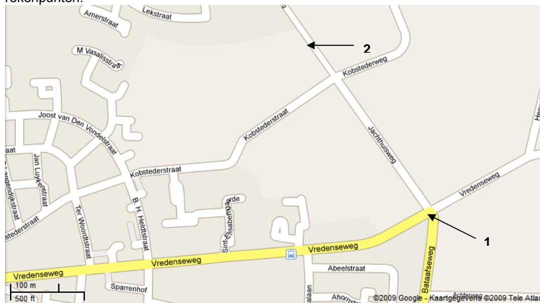
Tabel 2: ligging rekenpunten

In dit onderzoek zijn luchtkwaliteitsberekeningen uitgevoerd voor één rekenpunt twee rekenpunten.