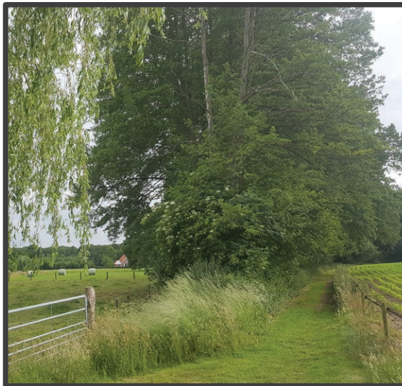
Foto 2 rechts, bestaande houtopstand o.a. met Zomereik