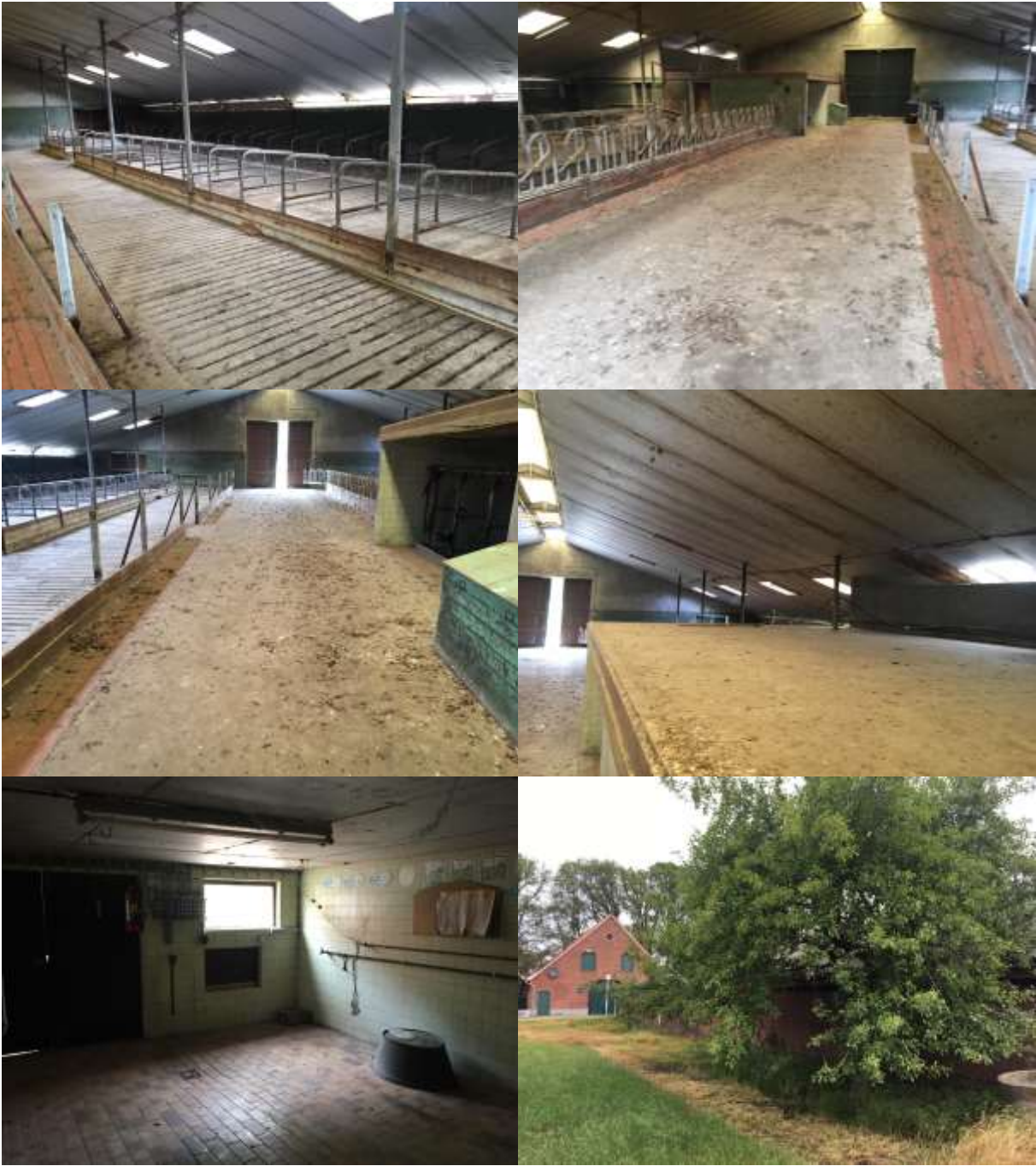
Bijlage 3. Fotobijlage. Impressie van het plangebied en de directe omgeving.