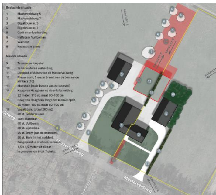
Verbeelding van het wenselijk eindbeeld

Het voornemen bestaat om een extra woning op het erf te realiseren. Deze woning is feitelijk reeds aanwezige in de woonboerderij. Het realiseren van deze extra woning is feitelijk een administratieve handeling. Ter compensatie voor de extra woning wordt een rundveestal op het erf gesloopt. Ook wordt erfverharding (kuilvoeropslag) verwijderd. De nieuwe woning krijgt een eigen erftoegangspad naar de Masterveldweg. Het nieuwe erf wordt nadien landschappelijk ingepast d.m.v. de aanplant van erfbeplanting. Op onderstaande afbeelding wordt een plattegrond van het wenselijk eindbeeld weergegeven.