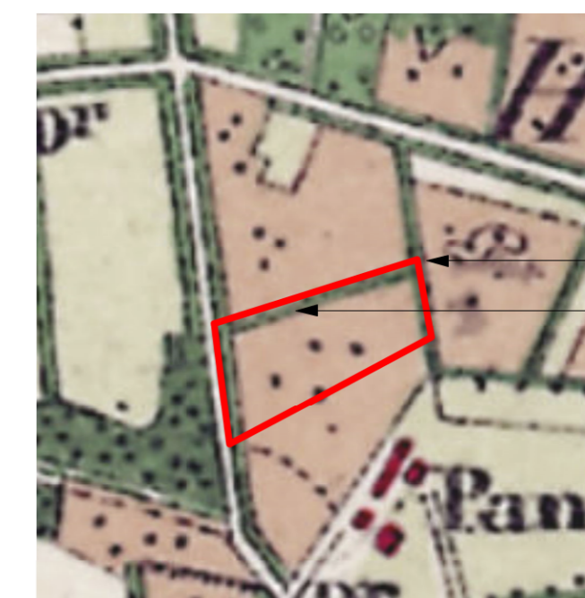
Kaart 1920

Beheer als hakhout: eens in de 12/15 jaar afzetten van max 70% van het element.