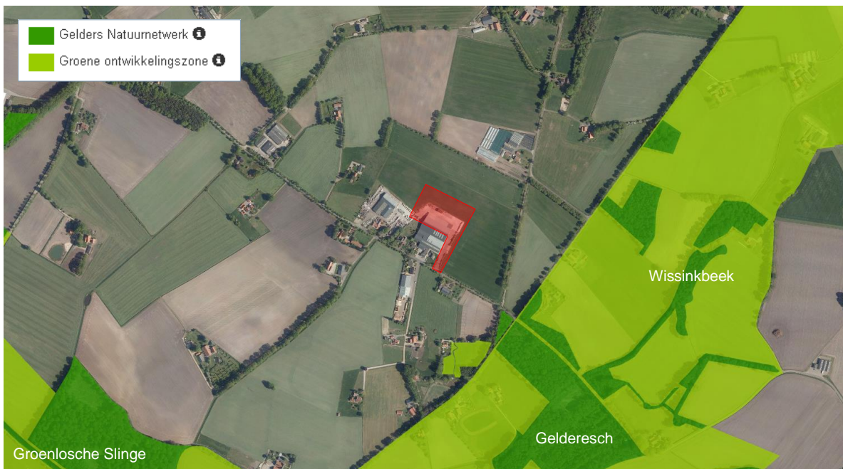
Figuur 3. Ligging van het plangebied (rood) ten opzichte van het GNN en de GO, bron: Provincie Gelderland 2021.

Het plangebied ligt niet in het NNN/GNN of in een GO (zie figuur 3). Op enige afstand van het plangebied (circa 150 meter) zijn bospercelen, bomenrijen en houtwallen op het landgoed Gelderesch en langs de Groenlosche Slinge en Wissinkbeek aangewezen als bestaande natuur binnen het GNN (zie figuur 4). Enkele agrarische percelen, bosschages en erven rondom de GNN-gebieden zijn aangewezen als GO.