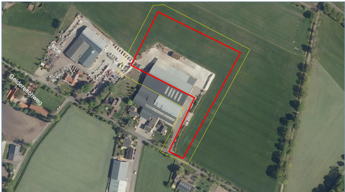
Figuur 2. Luchtfoto van het plangebied (rood omkaderd) en het onderzoekgebied (gele stippellijn).