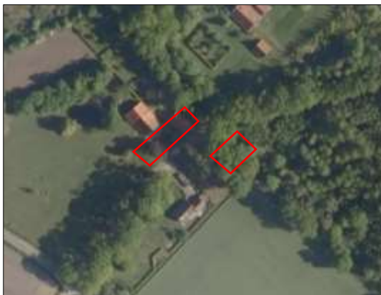
Begrenzing van het onderzoeksgebied; deze wordt met de rode lijnen aangeduid.

Om het effect van de voorgenomen activiteiten volledig in beeld te kunnen brengen, zijn de enkele loofbomen en de aangrenzende struiken langs de schoppe, meegenomen in het onderzoek. Indien in dit rapport gesproken wordt over plangebied, wordt onderstaand onderzoeksgebied bedoeld.