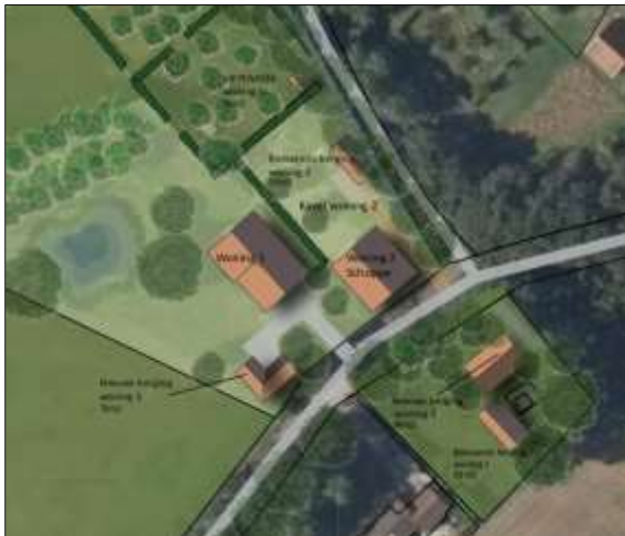
Verbeelding van het wenselijk eindbeeld.

Er zijn concrete plannen voor het verbouwen van de schoppe tot een woning en het realiseren van twee nieuwe bijgebouwen. Het westelijk gelegen bijgebouw wordt d.m.v. het aanleggen van een nieuwe verharde inrit in verbinding gebracht met het erf. In het oostelijke deel van het plangebied ligt al een verharde inrit. Het nieuwe erf wordt nadien landschappelijk ingepast d.m.v. de aanplant van erfbeplanting. Op onderstaande afbeelding wordt een plattegrond van het wenselijk eindbeeld weergegeven.