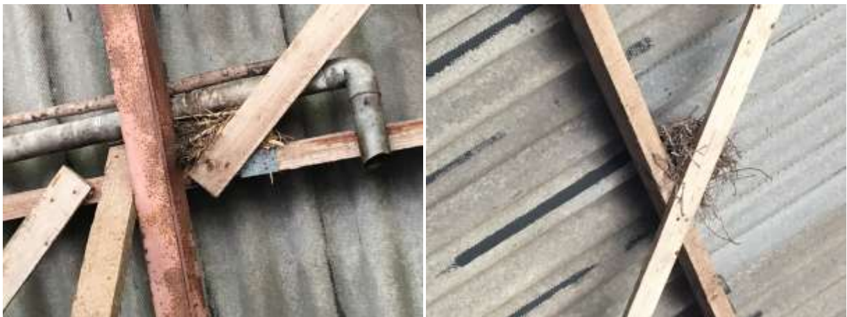
Oude nesten van de houtduif in de kapschuur.

Het plangebied behoort tot functioneel leefgebied van verschillende vogelsoorten. Vogels benutten het plangebied als foerageergebied en er nestelen vermoedelijk ieder voortplantingsseizoen vogels in de bebouwing. Er nestelen boerenzwaluwen op de deel van de boerderij, net buiten het plangebied en er zijn oude nesten gevonden van de houtduif in de kapschuur. Mogelijk nestelt de merel en de witte kwikstaart ook incidenteel in de bebouwing in het plangebied. Er zijn in het plangebied huismussen waargenomen, maar die nestelen onder de dakpannen van de boerderij en de bedrijfswoning, net buiten het plangebied. Ook nestelen er huiszwaluwen aan de achtergevel van de oude boerderij. Zowel de nesten van de huismus, als de nesten van de huiswaluw, worden niet negatief beïnvloed door uitvoering van voorgenomen activiteiten. Er zijn geen sporen gevonden die op de aanwezigheid van een nest- of rustplaats van de steen- of kerkuil in het plangebied duiden. Deze soorten verraden hun aanwezigheid doorgaans eenvoudig door schijfsporen en braakballen.