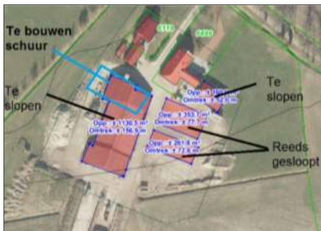
Verbeelding van het wenselijke eindbeeld.

Het voornemen bestaat om de ligboxenstal en de werktuigenberging te slopen en een nieuwe schuur op de plek van de ligboxenstal te bouwen. Op onderstaande afbeelding wordt het wenselijke eindbeeld weergegeven.