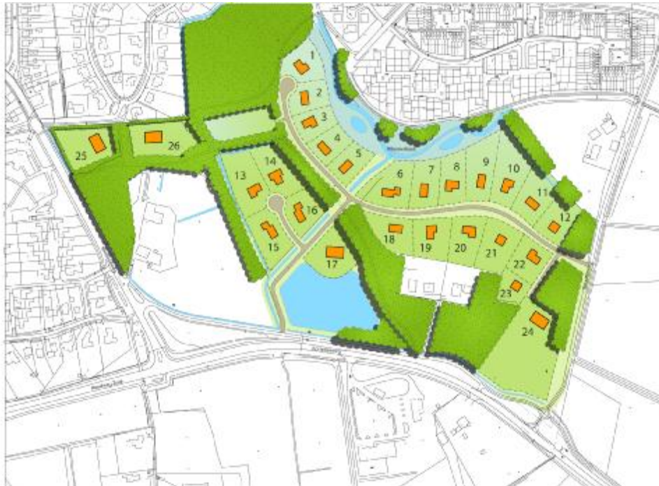
De stedenbouwkundige inrichtingsschets voor het plan Eelink

De opzet van het stedenbouwkundig plan (zie onderstaande schets) wordt voornamelijk bepaald door het reeds aanwezige landschap. De bestaande structuur van aaneengesloten bospercelen in combinatie met het dal van de Whemerbeek zorgt voor een boeiend en waardevol landschappelijk kader, waarbinnen de toekomstige bebouwing op natuurlijke wijze is ingebed. Het grootste deel van de toekomstige bebouwing wordt gesitueerd ten noorden van de van noord-west naar zuid-oost door het plangebied lopende bosstrook. De begrenzingen van dit plangedeelte, bestaande uit de hoog opgaande bossen en de ten noorden van de beek gelegen woonbebouwing met zijn opgaande groen, zorgen voor een zekere ruimtelijke beslotenheid. In het plan wordt deze beslotenheid nog versterkt door aan de oost- en noordostrand van het te bebouwen gebied een aantal nieuwe bospercelen aan te leggen.