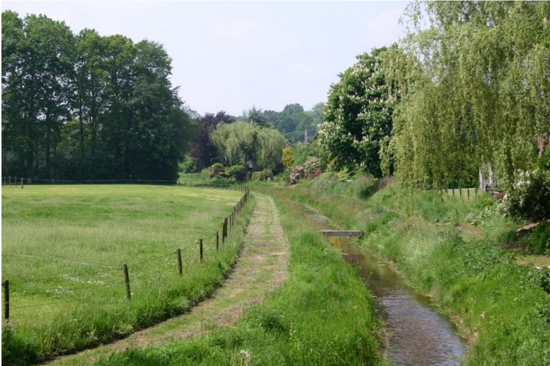
Het bestaande landschap met Wehmerbeek

Behalve door de karakteristieke ruimtelijke afwisseling van het gebied wordt de locatie gekenmerkt door de aanwezigheid van de Wehmerbeek. Deze vormt de zuidgrens van de wijk Pelkwijk.