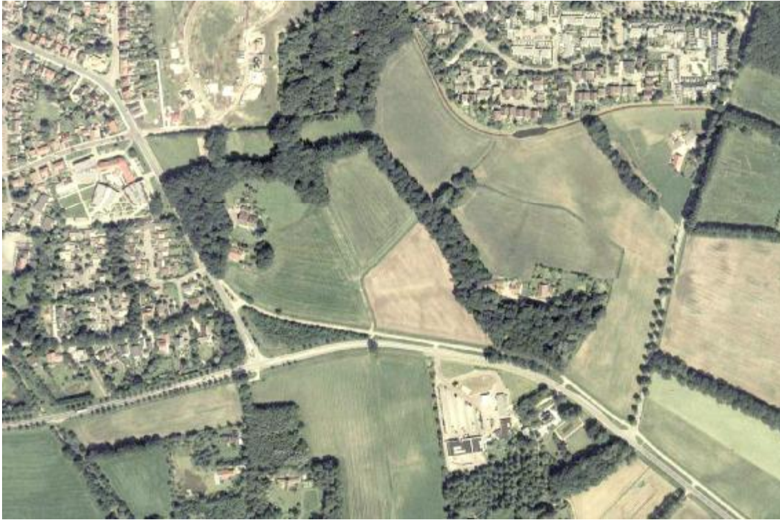
Luchtfoto van het plangebied