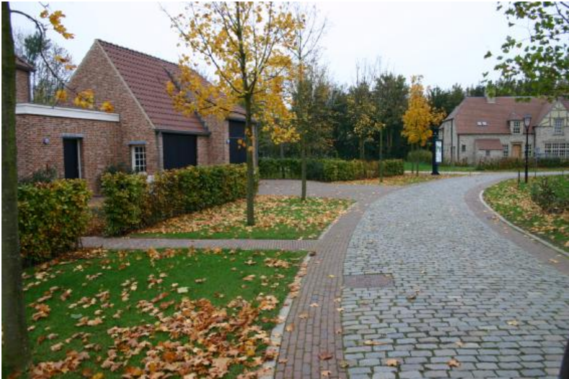
Mogelijke vormgeving van de ontsluitingsweg

Veel belang wordt gehecht aan de architectonische kwaliteit van de woningen die in het plan zullen worden gebouwd. Om deze kwaliteit te waarborgen is een beeldkwaliteitsplan opgesteld. Een kopie van het beeldkwaliteitsplan is als bijlage bij het plan gevoegd.